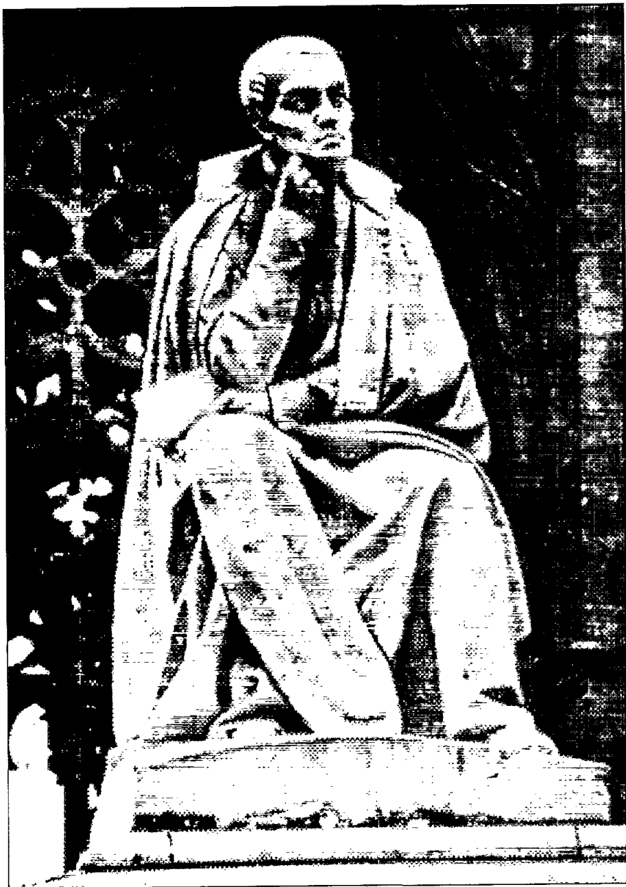
L'estàtua de Jaume Balmes, en actitud meditabunda, corona el panteó restaurat el 1865 al Claustre de la Catedral.