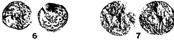
Fig. 6 i 7: Els mateixos senyals anteriors, contramarcats amb una estrella, en circulació entre novembre de 1493 i 1494, conforme a la nova paritat de la moneda d'or decretada per Ferran II (un ducat = 24 sous; un pacífic = 20 sous).