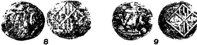
Fig. 8 i 9: Senyals de coure i estany, acabats de fabricar el mes de desembre de 1511 i el mes d'abril de 1512, destinats a circular durant un any. Volum encunyat: 700 lliures de cada.