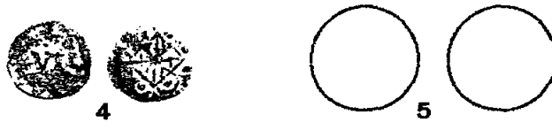
Fig. 4 i 5: Senyals de coure d'un i de dos diners, en circulació entre març i novembre de 1493 segons la paritat vigent de la moneda d'or (un ducat = 30 sous; un pacífic = 25 sous).