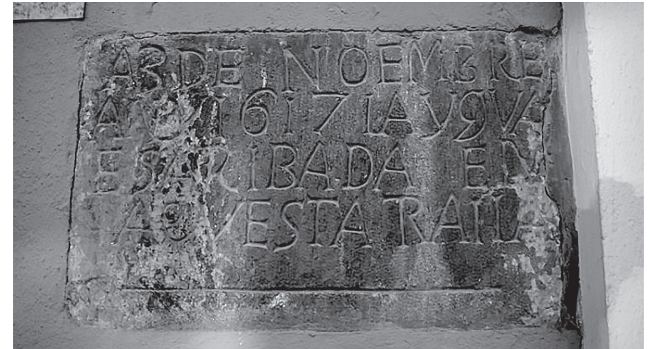
Testimoni del nivell que varen assolir les aigües al seu pas per Camprodon (actualment fora del seu lloc originari).

que quasi la derroca del tot, y si be dins los murs de la dita vila no feren les ditas riberas ningun malefici, empero tota la nit estigueren ab molt gran cuydado perquè la aygua començava ja [a] entrar per lo portal den Albareda y tots los qui tenian casa a la part del dit riu desdel portal den Albareda fins al portal den Planes buydaren les casas així de personas com de mobles per temor que com les ditas riberas venian tant crescudas no derrocassen les muralles y encara que no les derrocas com per misericordia de deu no les derroca ab tot tenia temor que entrant aygua per lo portal den Albareda, cenyeria tot lo gran carrer des del dit portal den Albareda fins al dit portal den Planes. Deu vulla no tornen mes semblants inundacions de ayguas y fonc lo major impetut de ditas ayguas en la darrera nit desde les vuit horas fins a les dotze y dins de aquexas quatre horas se feren los dits y altres malefics en Camprodon.» 12