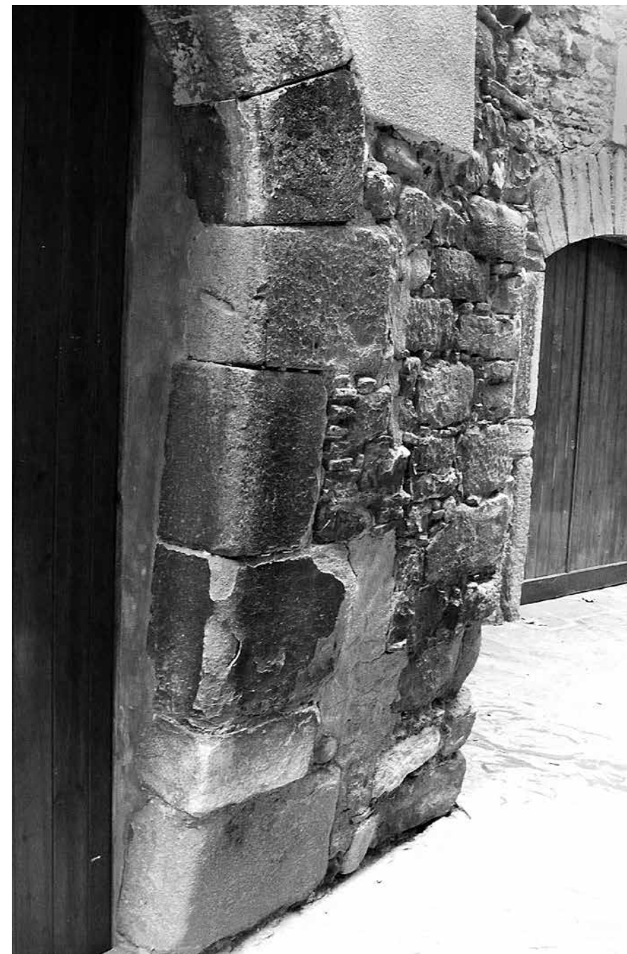
Situació de la mezuzà al carrer de l'Albergueria (Fotografia: I. Ollich).

La identificació d'un forat picat en un carreu a la porta d'entrada d'una casa del carrer de l'Albergueria, darrere la catedral, sembla correspondre a un forat de mezuzà . Es tracta d'un forat cilíndric, arrodonit pels dos extrems i picat a la pedra amb poca fondària, situat al terç superior dret de la porta, abans de començar