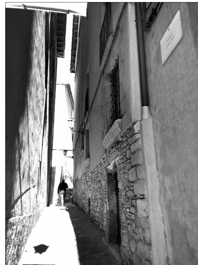
Imatge actual del carrer d'en Guiu (Fotografia: I. Ollich).

l'arc. Les seves mesures entren en els paràmetres dels forats de mezuzà coneguts: 110 mm de llargada, 20 mm d'amplada, i entre 8 i 10 mm de profunditat. El carreu amb el forat mesura 50-55 cm de llargada, entre 29 i 36 cm d'alçada i entre 19 i 21 cm de profunditat. La mezuzà està picada a la cara que correspon a l'amplada.