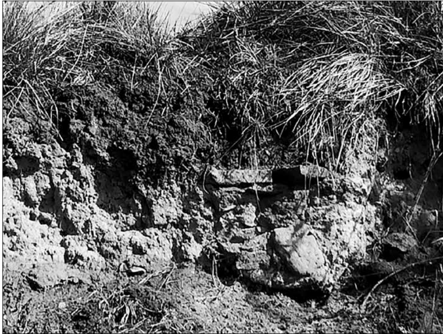
Imatge de la paret localitzada al Puig dels Jueus.

de Vic no era gaire gran (no va superar la desena de famílies al segle XIV), i que el cementiri es degué utilitzar des de 1327 fins a 1365 o 1391 (entre trenta i seixanta anys, el temps d'una o dues generacions), caldria esperar poques tombes.