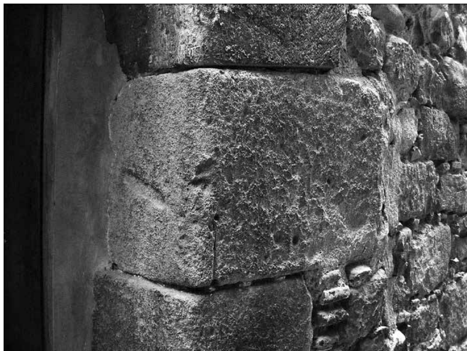
Situació de la mezuzà al carrer de l'Albergueria.