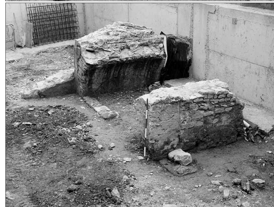
Intervenció arqueològica a Can Franquesa, amb el possible micvé.