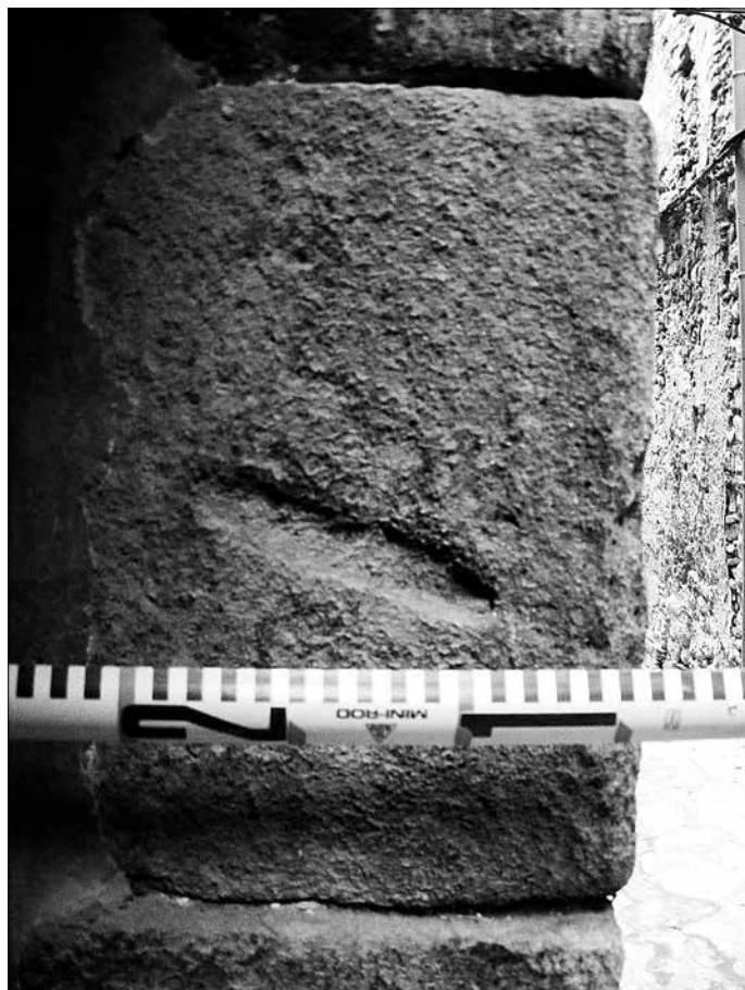
Detall de la mezuzà localitzada al carrer de l'Albergueria.