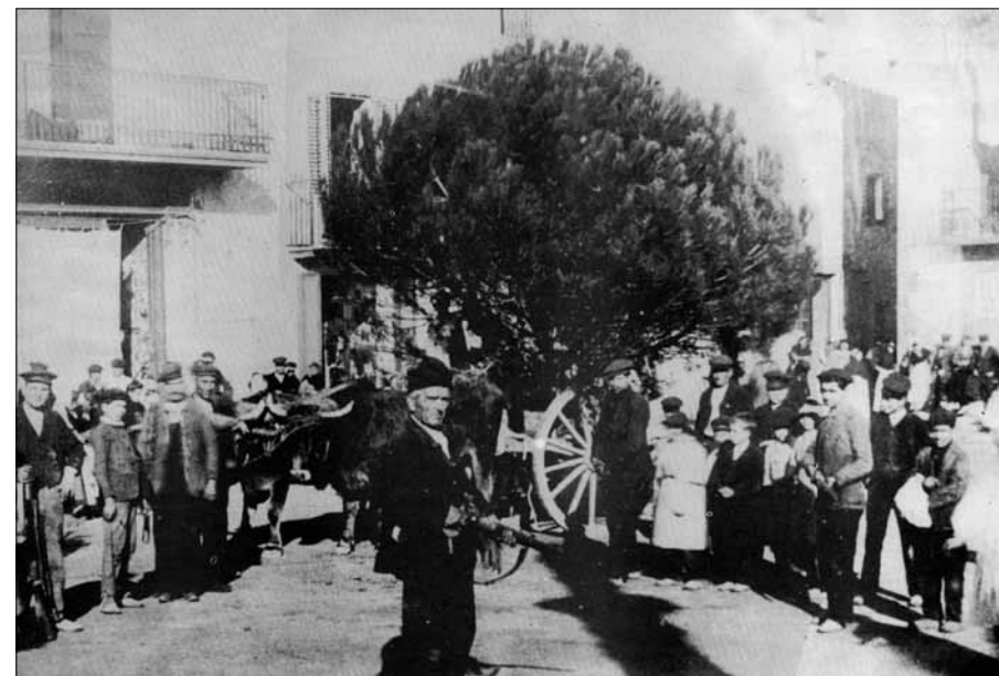
El pi a la plaça major de Centelles. Any 1904.