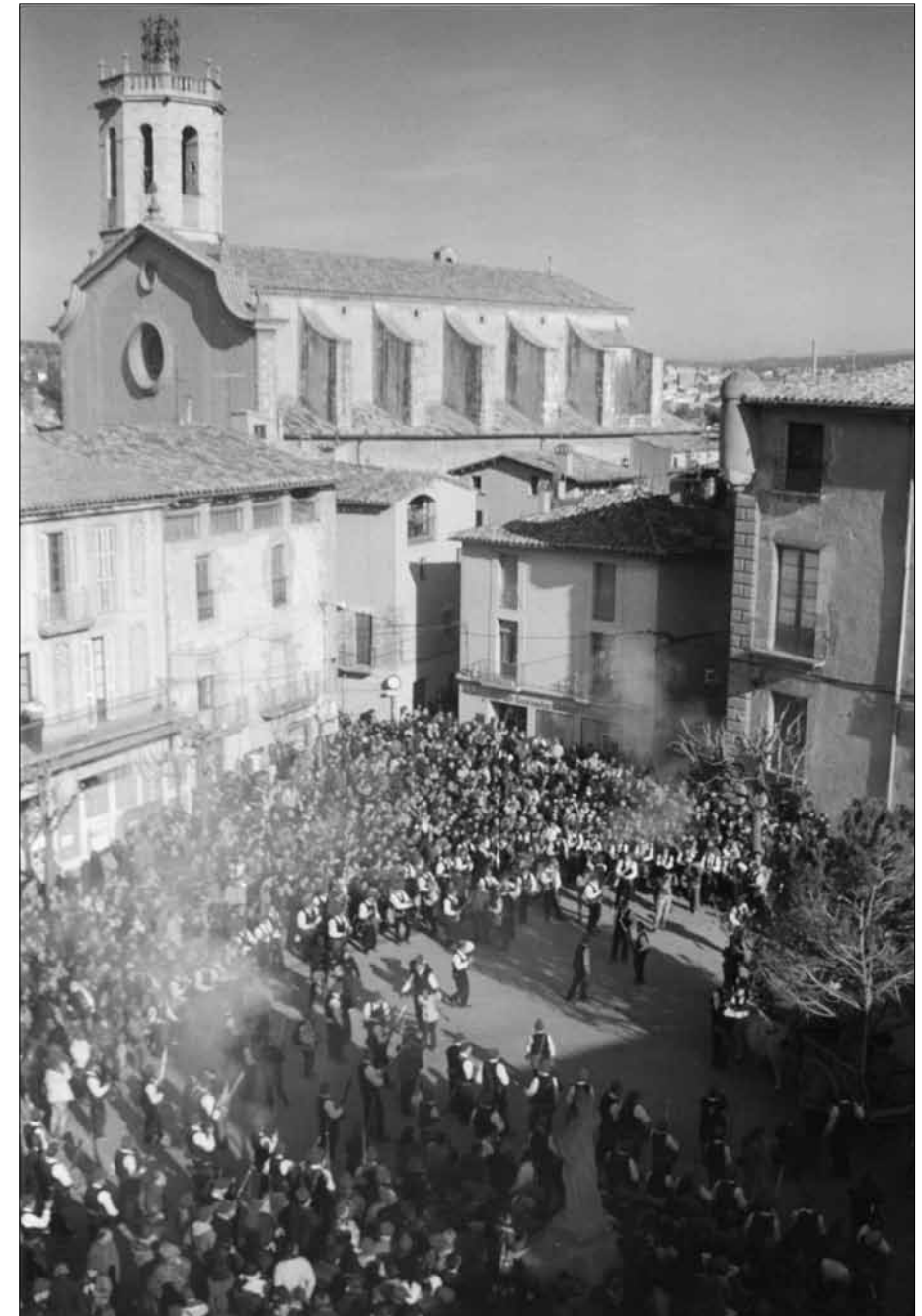
El pi a la plaça Major de Centelles envoltat dels galejadors disparant trets. Dècada de 1990.