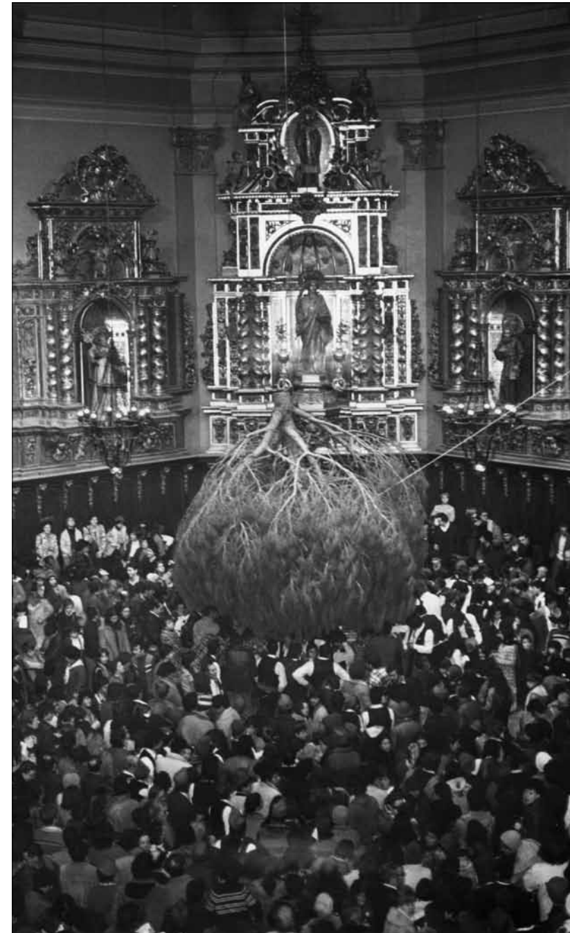
Moment en què es lliguen els penjolls de pomes amb la seva garlanda de neules, just abans que el pi sigui hissat. Dècada de 1980.