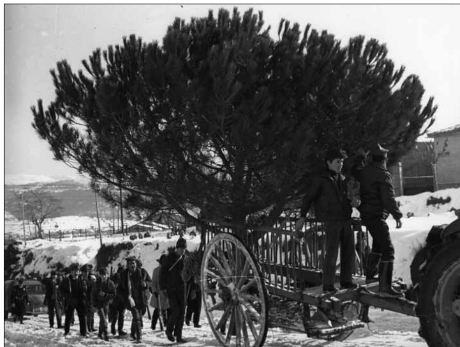
El pi es transporta al poble, on entrarà a les dotze del migdia. Any 1971.

Tot i que Mn. Fortià Solà desvinculà aquests trets d'arcabussos de la Festa del Pi, alguns estudiosos han insistit en què l'any 1620 és la primera referència històrica de la Festa del Pi, afirmació del tot inexacta. 9