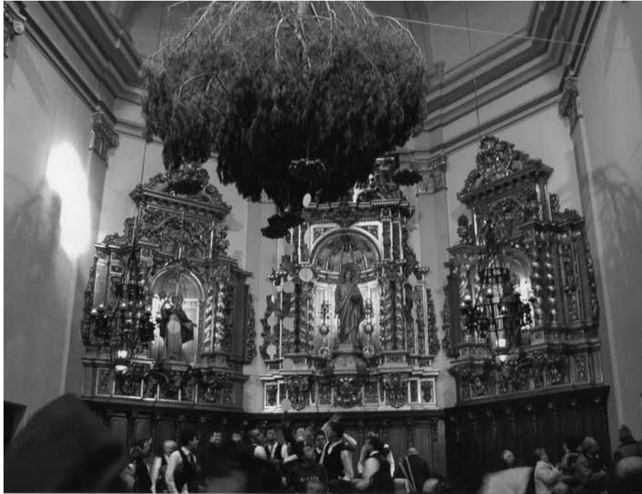
El pi penjat damunt l'altar, romandrà a l'església parroquial de Centelles fins el dia de Reis. Dècada de 1990.

pasajeros echan, cuya llave tendrá el rector; que las demás limosnas que se recogieren las haya de entregar el hermitaño al rector, y éste las empleará en ornamentos y adorno a la capilla; que las caridades de misas que recogiere el hermitaño o qualquier otro se entreguen al rector y éste las haga celebrar, notando el cargo y descargo de estas misas en un libro que formará de administración de dicha capilla de San Antonio, en cuyo libro notará también el inventario de ornamentos y pondrá las cuentas de las limosnas que se recogen y del empleo de ellas.