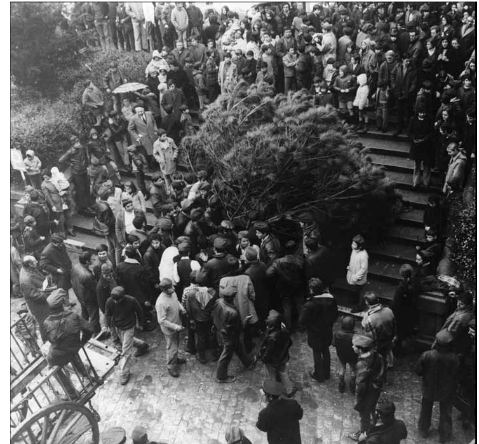
Davant de l'església, el pi puja a força de braços per l'escala. Dècada de 1970. Fotografia de Jordi Sarrate. Col·lecció de Jordi Sarrate.

La tercera dada fa referència a una còpia del privilegi del 5 de març de 1716 redactada el 28 de maig de 1790 i que es conserva a l'ABEV, fons Fortià Solà, caixa 2. 38 El fet que a finals de segle encara es redactessin còpies autenticades del privilegi evidencia una vigència absoluta del dret d'armes.