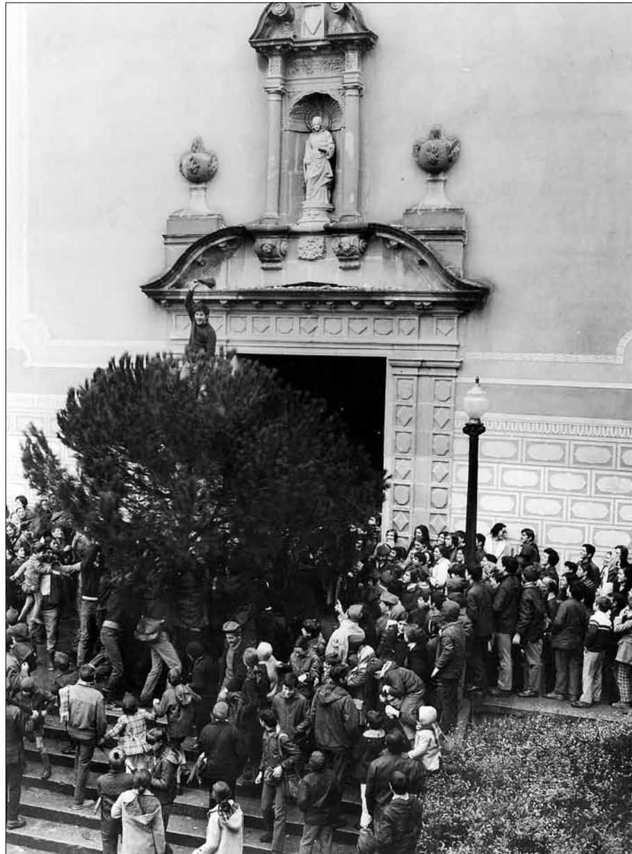
Galejador saludant amb la barretina, mentre el pi balla al replà de missa. Dècada de 1970.