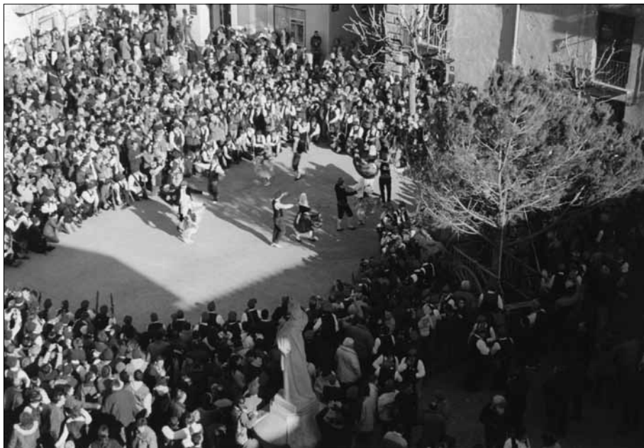
El Ball del Pi. Dècada de 1990.

d'abril de 1716 es va elaborar «un informe de los sugetos mal afectos y indignos de usar armas». En l'informe consten 268 homes, dels quals 31 centellencs i les seves famílies són considerats mal afectes i 41 són destacats com a molt afectes. En el cas de Tagamanent hi ha 16 famílies afectes i 14 de desafectes, mentre que a Ayguafreda hi ha 12 famílies afectes i 10 de desafectes. 32