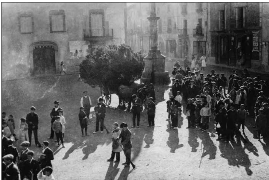
El pi a la plaça Major de Centelles amb els galejadors disparant trets. Any 1919.

«Pero si no estamos seguros de que en Cataluña se hiciera consumo de barquillos como alimento en las iglesias, no podemos dudar de que estos servían para enramar y adornar las iglesias, costumbre que todavía se sigue en las parroquias rurales, durante las fiestas de Navidad, adornándose los candelabros y los altares con guirnaldas que van de un lado a otro. Esta costumbre de adornar así el templo es muy antigua, pues que a ella hace referencia un acuerdo capitular de Vich, del año 1303, en que se ordena que los administradores del común del Capítulo, llamados “comuners”, debían dar al cantor o precentor menor por la Cuaresma, media cuartera de harina candeal, para hacer barquillos, con objeto de adornar el coro y el resto de la iglesia, según era costumbre.» 22