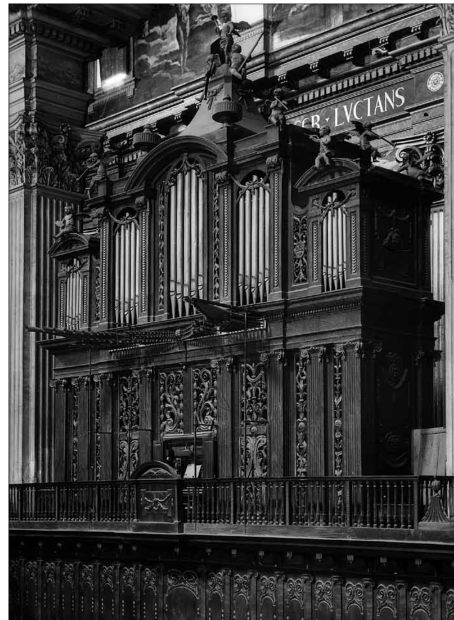
Orgue Jean Pierre Cavallé de la catedral de Vic (1796) (IAAH).