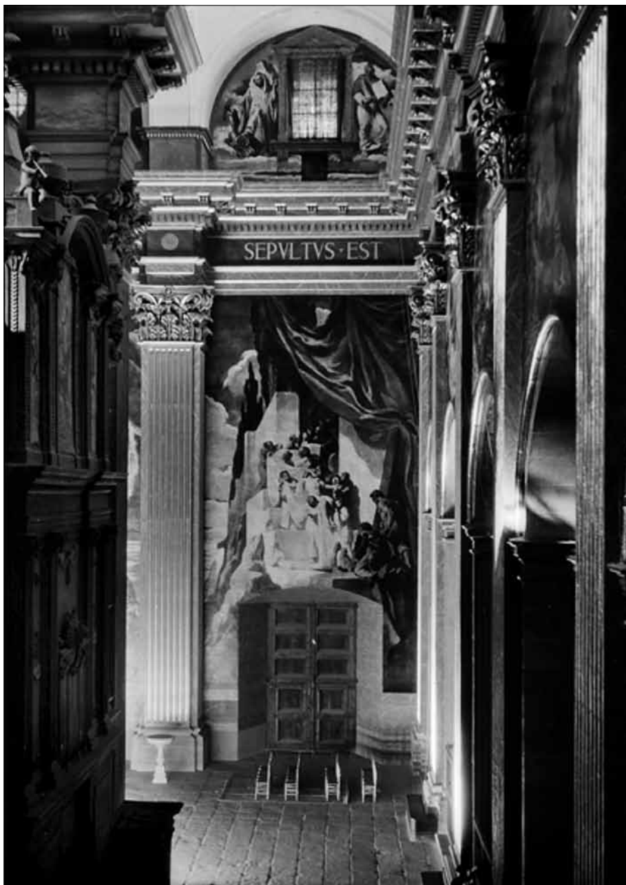
Façana posterior de l'orgue. (IAAH)