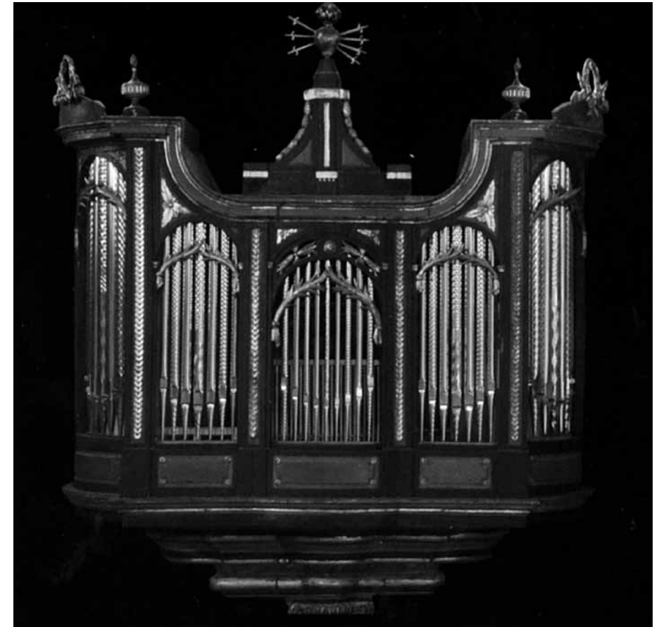
Orgue de l'església dels Dolors de Vic. Moble de Josep Duran (1805).

de la part superior. I es distribueixen uns plafons de fusta treballada amb cardina (motiu ornamental basat en fulles de card) que permeten la sortida del so de la cadireta i de les contres en direcció al cor capitular. Al centre, la consola en finestra. La part superior està formada per cinc castells de tubs —el central, dels de majors dimensions— que formen un total de 25 flautes. El primer, tercer i cinquè estan coronats amb frontons corbats complementats amb garlandes i decoració de rocalla. L'àtic s'acaba amb una teulada en forma piramidal. Com a motius al·legòrics, un bon grapat de puttis o angelots amb instruments musicals. La part posterior de l'instrument estarà formada per la mateixa distribució de castells i elements decoratius que a la part davantera, però els espais dels tubs estaran tancats per plafons de fusta treballada i decorats amb pintures.