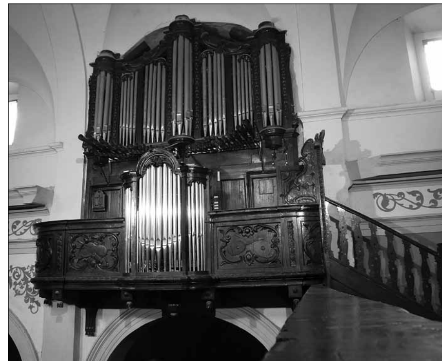
Orgue de Torroja del Priorat (1798-1799).

àtic, al pis superior, que tradicionalment estarà ocupat a un cantó per l'orgue i, oposadament, per la cantoria o zona reservada als músics de la capella de música de la catedral.