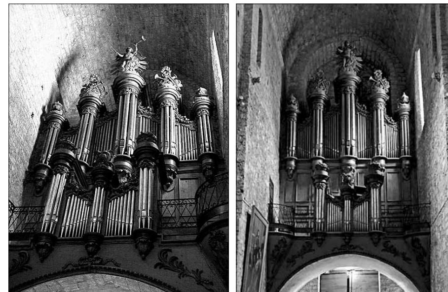
Orgue de l'antiga abadia de Gellone a Saint Guilhem-le-Désert (França).

Taula comparativa dels tres pressupostos: