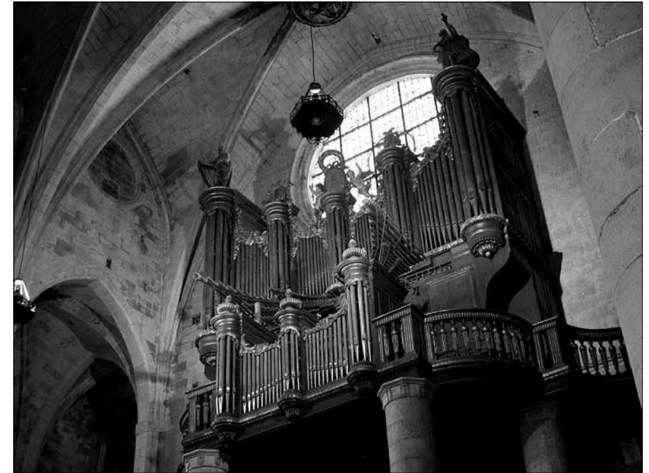
Orgue de la basílica de Santa Maria de Castelló d'Empúries.