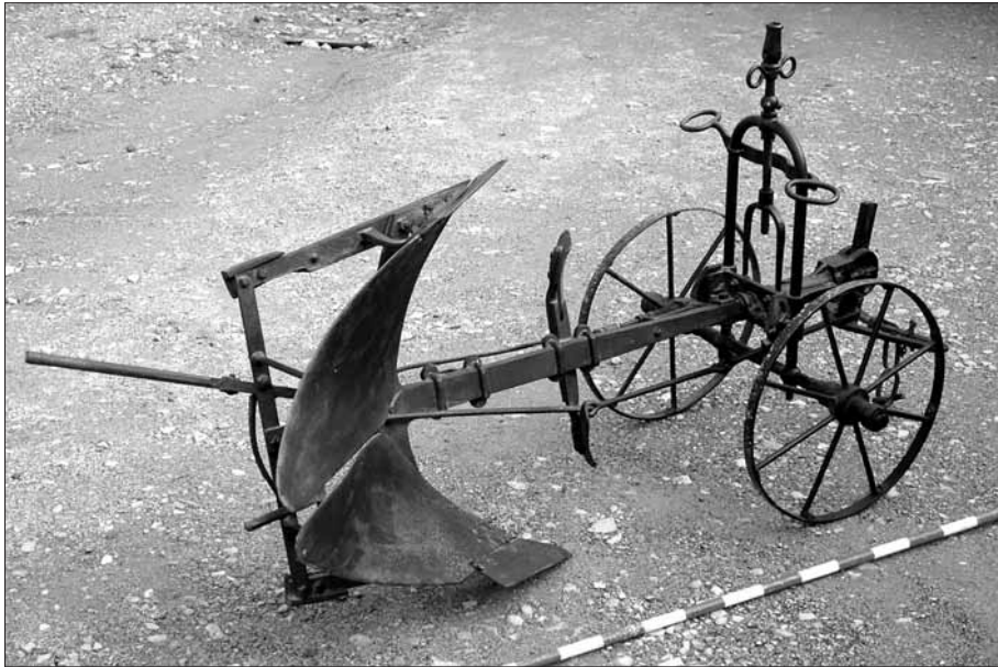
Arada de rodes o brabant, màquina que va ser adquirida pel mas Colomer a principis del segle XX.

plana de Vic ha esdevingut un referent en les produccions porcina i lletera de Catalunya i Espanya. 3