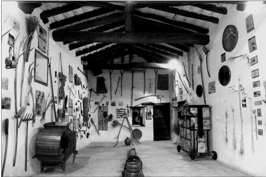
Vista general de la Sala del Museu del Blat.