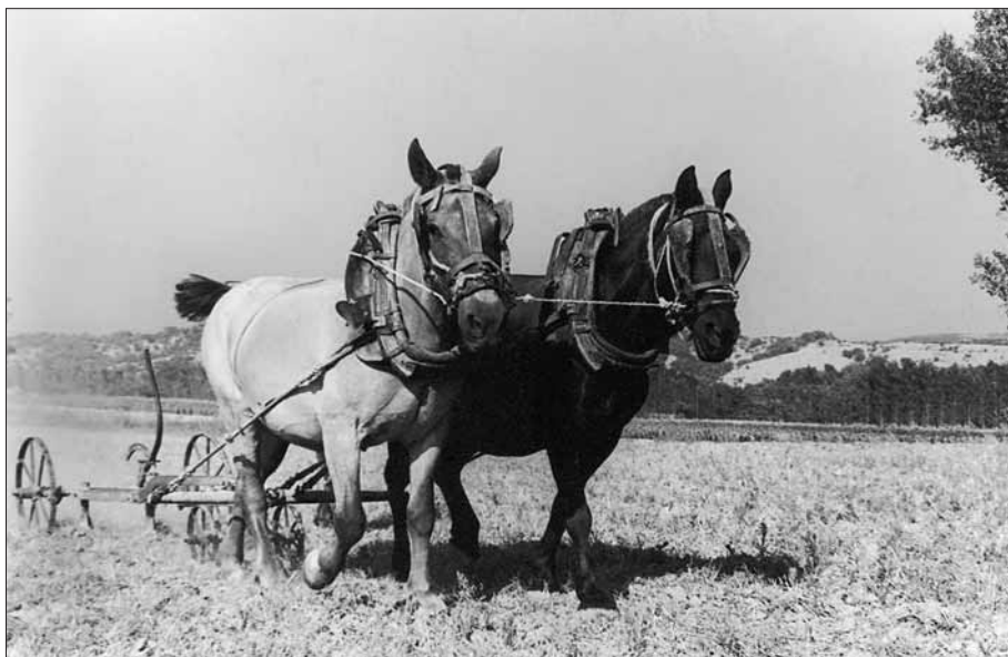
Parell d'eugues del Colomer enganxades a l'estripadora treballant en un rostoll durant la dècada de 1950.

per George Henri Rivière 13 hagi tingut aproximacions molt diverses, unes més afortunades que d'altres, pensem que moltes de les propostes del museòleg francès són vigents i encaixen plenament amb la filosofia que hauria de regir el futur museu.