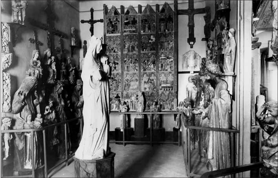
Interior del Museu Episcopal de Vic a l'època de mossèn Gudiol.

En acabar l'Exposició Universal de Barcelona el bisbe Morgades va programar definitivament l'obertura del nou Museu Episcopal de Vic. Al costat de l'església vigatana figures com les d'Antoni d'Espona o Joaquim d'Abadal cal considerar-les com les pioneres del col·leccionisme d'art medieval català, els quals haurien de marcar la tendència d'aquest tipus de col·leccionisme a tot el país. La seva concepció de salvaguarda i estudi de la història i l'art de Catalunya coincidí amb la dels historiadors de l'Acadèmia de les Bones Lletres de Barcelona. Aquest esperit de la Renaixença de la ciutat de Vic, caracteritzat per l'interès en l'estudi de la història de Catalunya i sobretot del seu passat medieval, va orientar en gran part la política museística dels futurs museus de Barcelona i de tot el país.