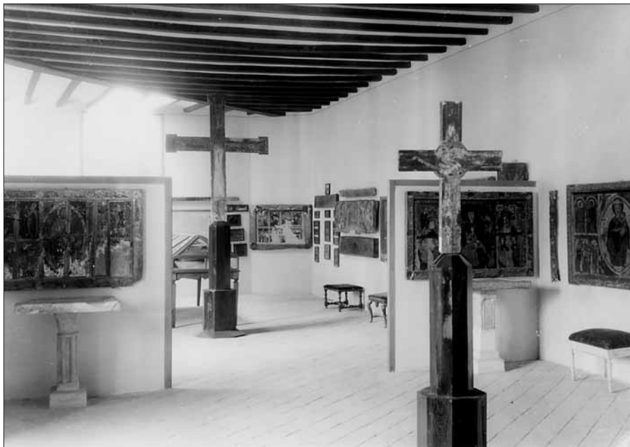
Interior del Museu Episcopal de Vic a l'època del Dr. Junyent.

Aquest manual va servir durant molts anys com a model per als museus diocesans creats a Catalunya a l'hora d'orientar la formació i l'ordenació museogràfica de les seves col·leccions. Aquest text també té el mèrit d'haver recopilat un lèxic amplíssim en llengua catalana de l'art i els oficis artístics catalans, els quals es trobaven en vies de desaparició. També té el mèrit de ser un dels primers textos en llengua catalana on s'exposen criteris de conservació i restauració d'obres d'art. 7