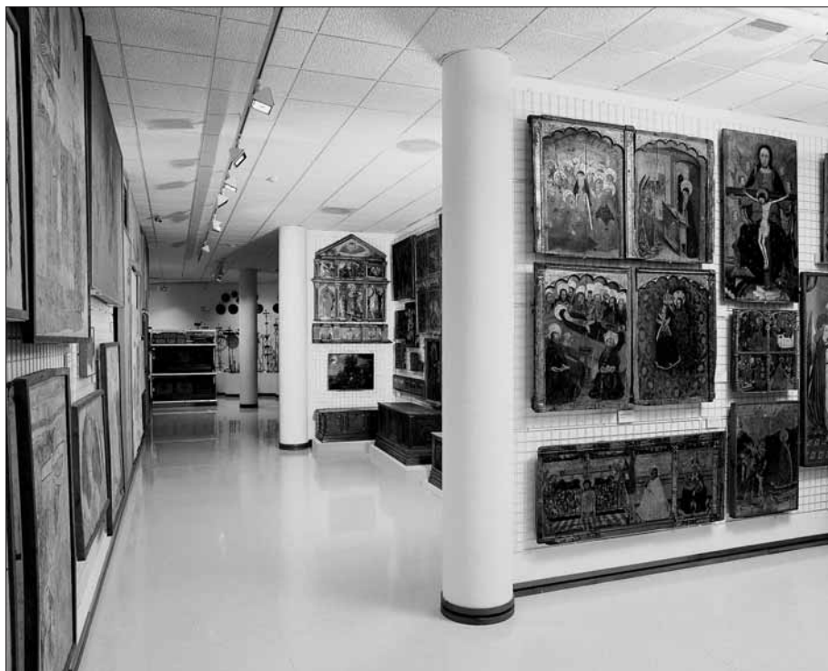
Fotografia de les galeries d'estudi.