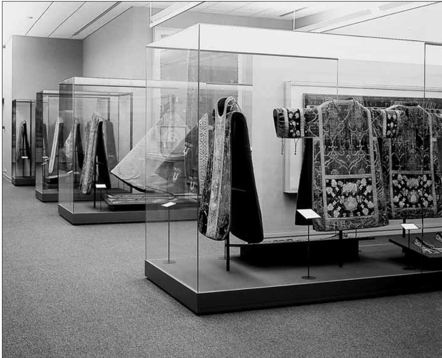
Fotografia de la sala d'indumentària.

Museu, recupera la mateixa ubicació museogràfica duta a terme pel doctor Eduard Junyent.