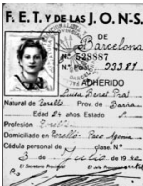
Carnet provisional de F.E.T. y de las J.O.N.S. d'una de les militans torellonenques.

mort en segons quins casos, i en canvi aquí veiem que tot i que es té en compte aquest passat figura com a militant de la Sección Femenina de Torelló. Ramon Pujol Basco ha insistit en el paper quintacolumnista del PSUC a Torelló durant el domini de la CNT, 12 cosa que podria explicar els estranys antecedents d'aquesta militant feixista. D'altra banda també és sobradament coneguda la tesi que explica l'afiliació al PSUC o a la UGT de molta gent durant la Guerra per la moderació i oposició que aquestes organitzacions mostraven envers actituds més radicals com les de la CNT i la FAI. Sigui quina sigui la resposta, el que és segur és que Benet devia comptar amb uns bons avals un cop acabada la Guerra.