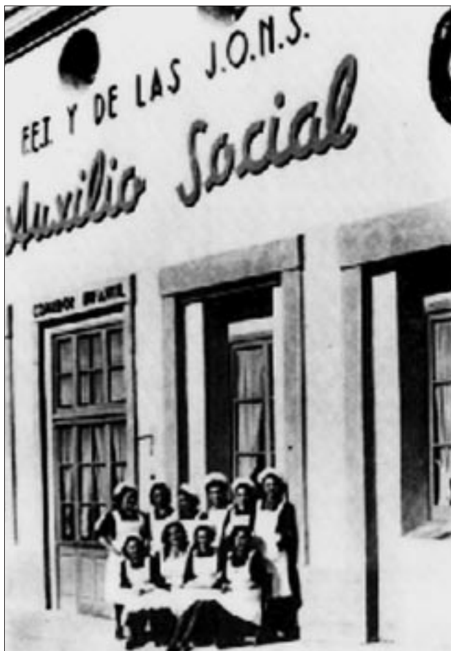
Fotografia del menjador infantil torellonenc on noies de la població exercien el Servicio Social.

gratuïta, molt útil en plena postguerra, era allixonada al mateix temps en les doctrines del Nacional-Sindicalismo.