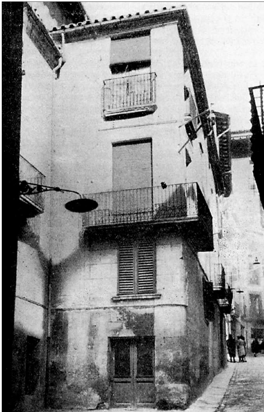
El darrer estatge del Círcol al carrer de Sant Hipòlit.