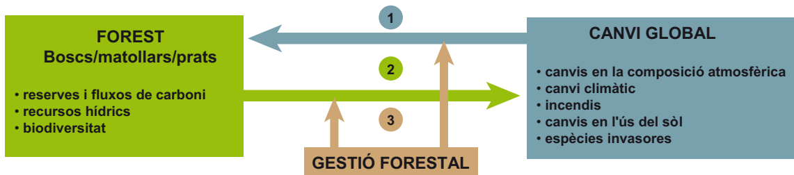
Figura 2. La interacció entre els ecosistemes i el canvi global es desenvolupa a través de tres eixos fonamentals: 1, la influència del canvi global en l'estructura i el funcionament de la muntanya; 2, la manera com les forests poden fer variar els efectes del canvi global; i 3, la modificació de les interaccions mitjançant la gestió forestal.