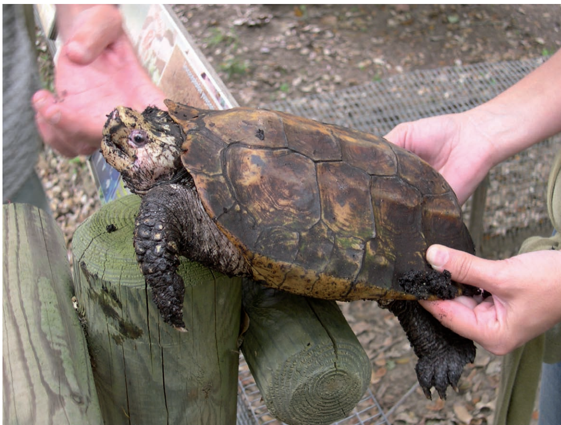
Figura 1. Exemplar captiu de Leucocephalon yuwonoi en el centre A Cupulatta a Còrsega.

nombre considerable d'exemplars són deco-missats en les operacions contra el comerç il·legal d'espècies i, malauradament, un nombre indeterminat de tortugues continuen entrant en aquest mercat negre. Altres amenaces que pateix aquesta espècie són les cremes dels boscos de bambú on viu i la predació sobre els nius i juvenils que exerceix Potamochoerus larvatus (espècie de senglar africà introduïda per l'home a Madagascar) i que possiblement impedeix el reclutament en la població i, per tant, la seva viabilitat a llarg termini.