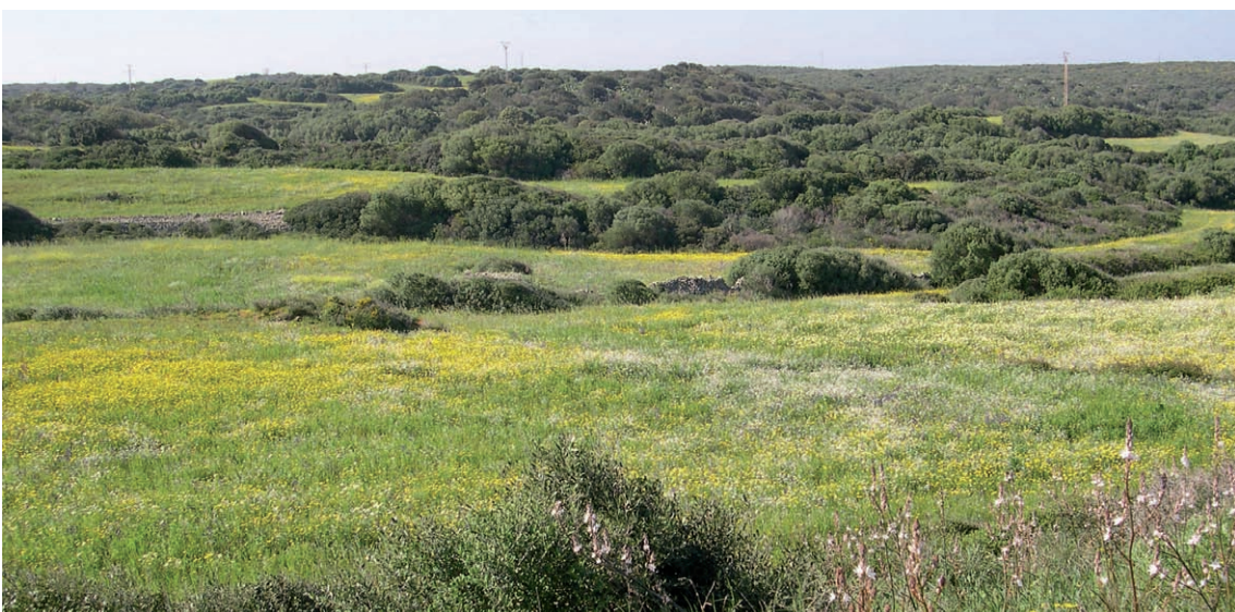
Figura 5. Diferents tipus de paisatges a Menorca, on es troben bones poblacions de tortuga mediterrània. A, vista d'un bosc esclarissat d'alzines, antigament pasturat pels ramats; B, paisatge agrícola ocupat per camps de conreu extensius amb marges de vegetació abundant que serveixen de refugi a les tortugues.