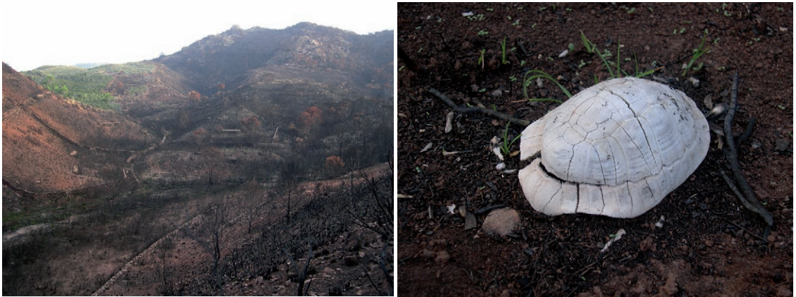
Figura 3. A, zona dels Alocs (Menorca) després de l'incendi forestal de 2006; B, detall de les restes d'una tortuga trobada en la zona cremada.

aquestes estimacions poden estar infravalorades, ja que no es consideren els individus que queden totalment calcinats (com ara els juvenils més petits), els que moren dins de refugis no visibles, els no trobats i els que moren posteriorment a conseqüència de les ferides.