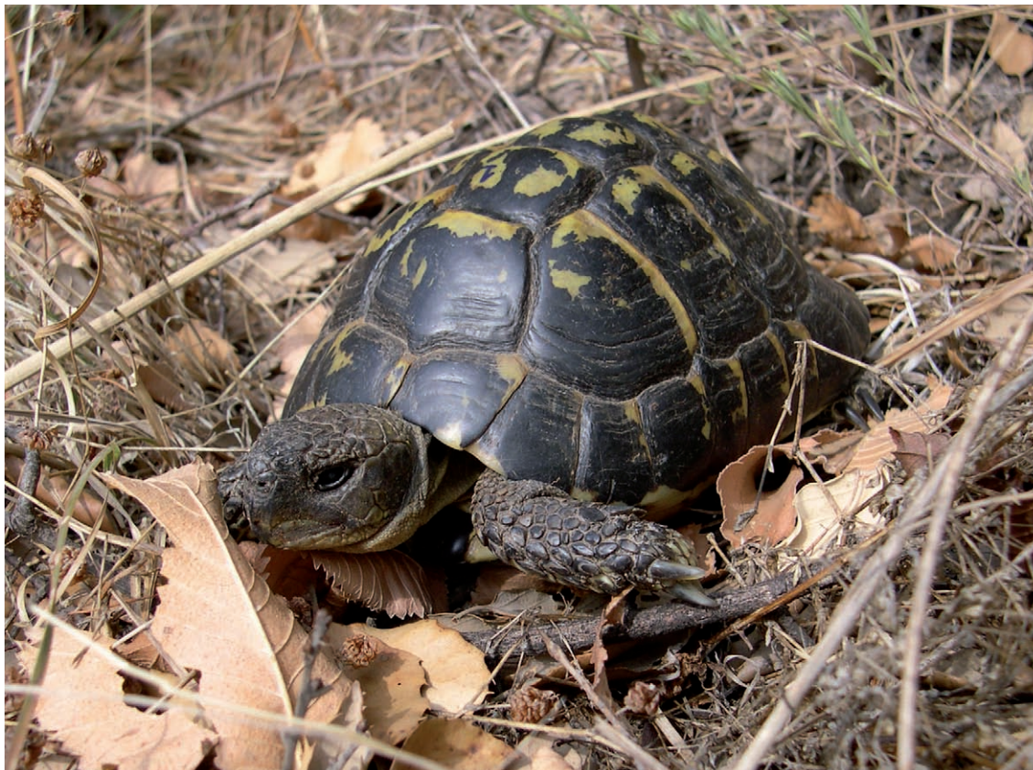
Figura 2. Mascle adult de tortuga mediterrània de la serra de l'Albera. (foto Albert Bertolero).

(Cheylan, 1981; Morales i Sanchis, 2009). Actualment a Espanya només queden poblacions de tortuga mediterrània a Catalunya i a les Illes Balears (Mallorca i Menorca). L'estat de conservació a Catalunya és extremadament delicat, ja que l'espècie es troba en franca regressió, per la qual cosa és considerada en perill d'extinció i s'han desenvolupat diferents projectes de reintroducció. A les Balears, la seva situació és molt millor, especialment a Menorca on l'espècie és molt abundant, mentre que a Mallorca s'ha detectat una fragmentació i una contracció de les seves poblacions. D'altra banda, amb la finalitat d'incrementar-ne el nombre de poblacions i contribuir en la seva recuperació en la península Ibèrica, el 2005 es va iniciar al País Valencià un projecte d'introducció que encara és en fase de consolidació (Vilalta, 2010).