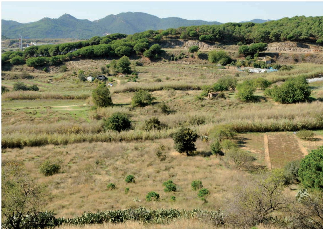
Figura 3. Espai obert antigament conreat i actualment en vies de colonització per la vegetació natural (Foto: Jordi Corbera).

disminuït considerablement. Molts d'aquests espais han estat sotmesos a fortes tensions immobiliàries de caire especulatiu; i sinó, els camps han estat abandonats per fer explícita la necessitat de modificar els plans directors urbanístics municipals i així poder passar a ser espais urbanitzables programats. Concretament a la comarca del Maresme, la zona agrària periurbana s'ha vist substituïda en aquests darrers anys en benefici de l'expansió urbanística creixent, o bé per l'establiment de grans zones de serveis i de grans infraestructures, o també per polígons industrials poc consolidats (Sabater et al., 1997a). En canvi aquelles zones que quedaven un xic més allunyades de la ciutat, si l'activitat agrària no ha tingut continuïtat, aleshores aquests espais han esdevingut cada cop més naturalitzats (fig. 3). Durant els darrers 20 anys, molts d'aquests espais s'han mantingut relativament oberts sense la frondositat de la vegetació arbrada (Sabater et al., 1997b). Des d'un punt de vista ecosistèmic, aquests espais esdevenen transitoris i deixen que la successió natural de les espècies que colonitzen aquests indrets faci el seu curs cap a estadis més madurs formats per masses boscoses. Els ecòlegs anomenen aquests espais de transició espais de successió secundària pel fet que la colonització per part de les espècies que inicia tot aquest procés no comença de zero, sinó que la colonització s'inicia a partir de poblacions herbàcies ja