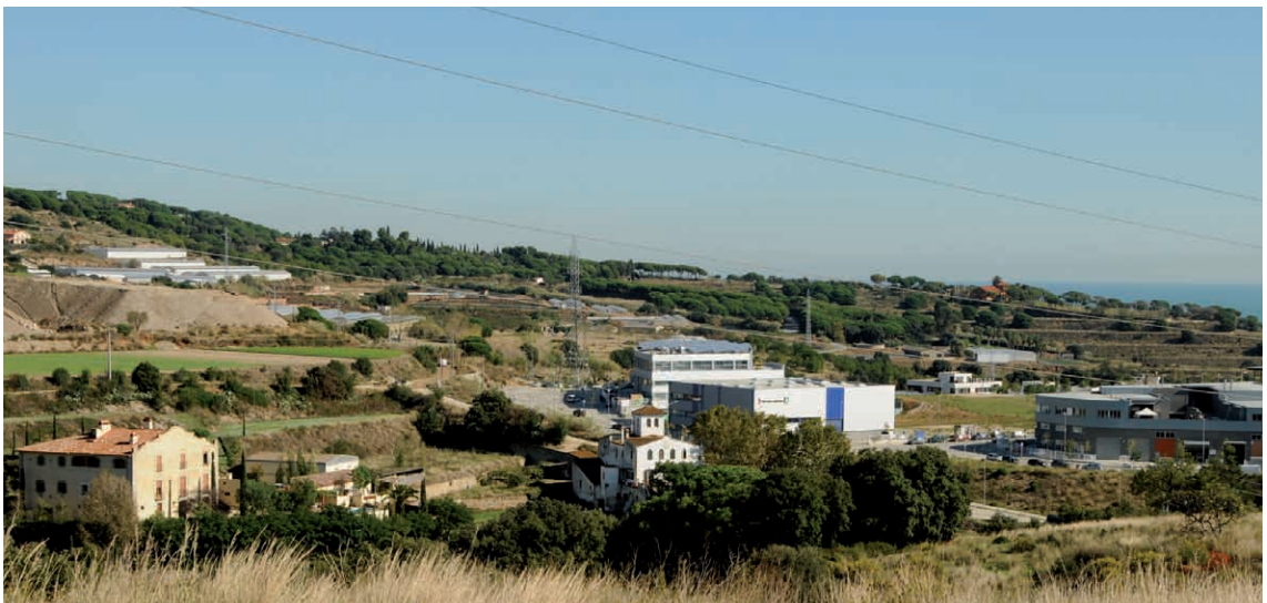
Figura 2. Paisatge desendregat sense una planificació urbanística clara on les indústries es barregen amb les masies i camps de conreu.

En les darreres dècades, les zones agrícoles properes a les regions metropolitanes han