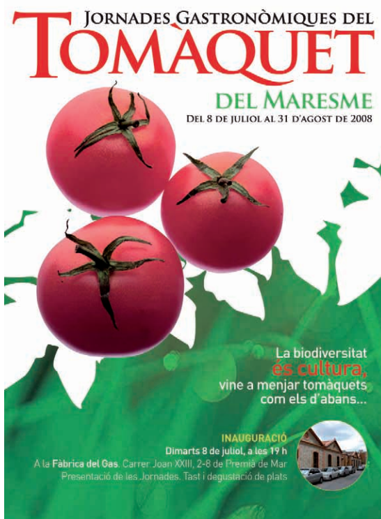
Figura 9. Anunci de les Jornades Gastronòmiques del Tomàquet que organitza el Gremi d'Hostaleria i Turisme de Mataró i el Maresme i a les quals, el 2008, van participar una quarantena de restaurants de la comarca.

proximitat». En aquest mateix sentit també es proposa la creació d'una agrobotiga o cooperativa agrícola que pugui donar sortida directa des del productor al consumidor i eliminar els passos intermedis que encareixen el producte i n'augmenten el cost ecològic (transport, emmagatzegament...).