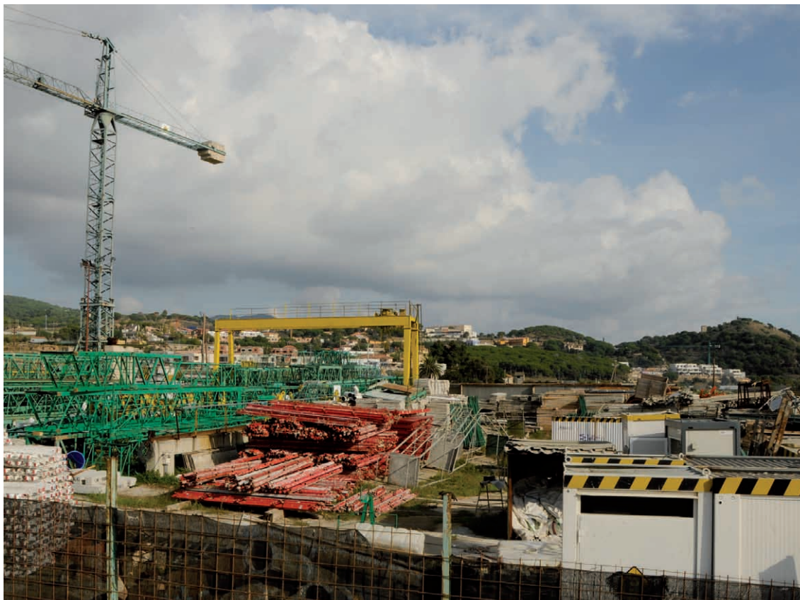
Figura 5. Activitats disconformes amb els usos agrícoles a l'espai agrari de les Cinc Sènies.

La singularitat de qualsevol paisatge agrari és la seva activitat; i sense ella el paisatge deixa de ser funcional i dinàmic. Un dels avantatges que té aquesta zona de les Cinc Sènies és la seva rendibilitat agrícola, si es compara amb altres espais rurals periurbans, com és el cas de les zones agrícoles de la comarca del Vallès (Jornet, 2006). Per tant, cal potenciar i fomentar l'activitat agrària si volem seguir gaudint de paisatges oberts amb un cert interès naturalístic i ambiental. No té cap sentit si només tenim present la seva protecció, sinó que cal gestionar pro-activament el territori si no volem que es converteixi aquesta zona en una mena de