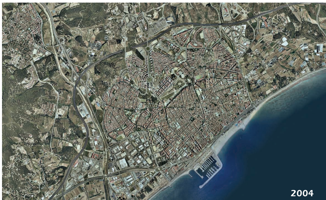
Figura 7. Fotografies aèries de l'àrea de Mataró fetes el 1956 i el 2004 on s'observa la disminució de la superfície agrícola.

Sènies redactat l'any 2002 pot servir de base per al seguiment de la dinàmica dels usos.