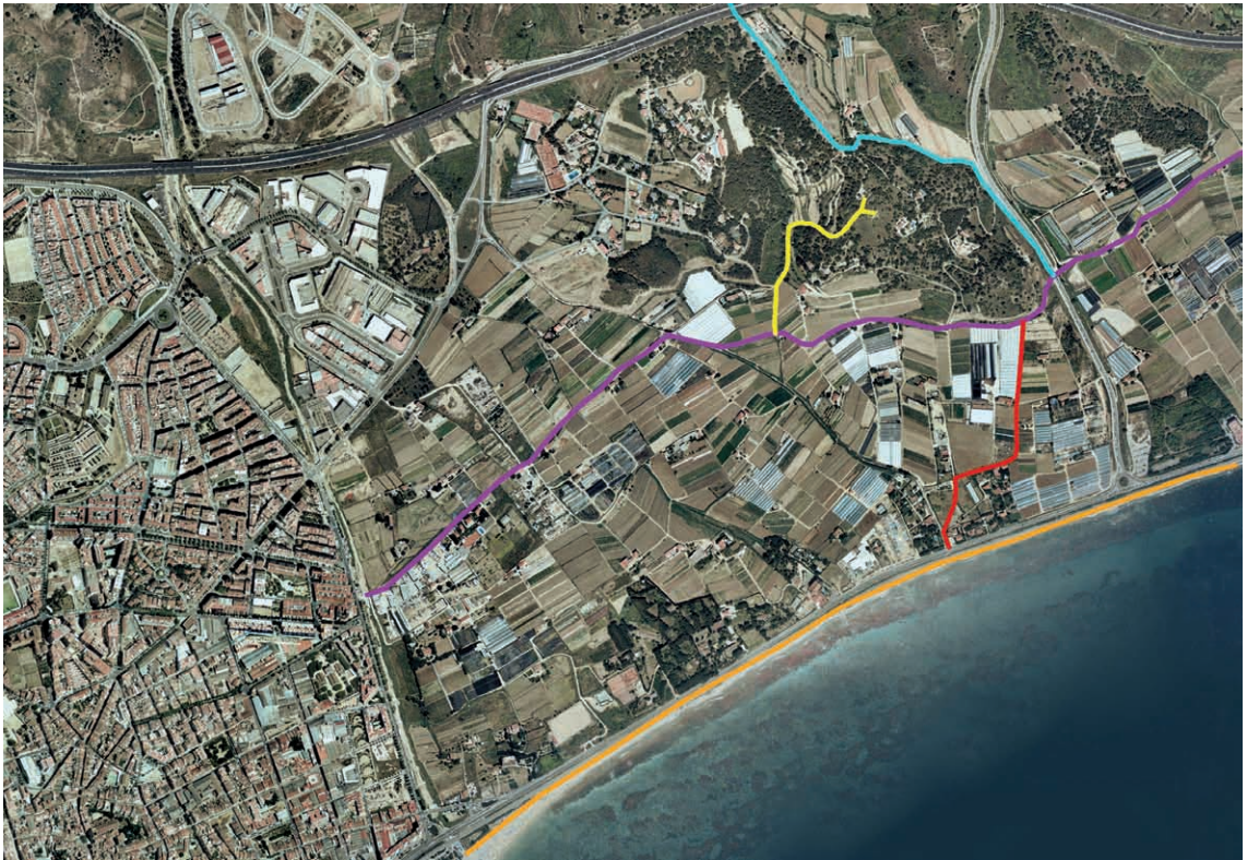
Figura 8. Proposta preliminar d'itineraris de descoberta del paisatge de les Cinc Sènies.