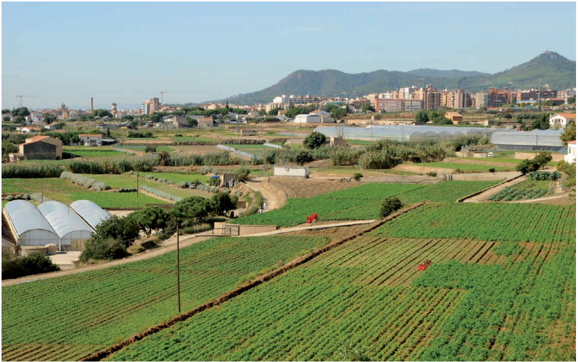
Figura 4. Visió de la part sud de les Cinc Sènies, al fons Mataró.