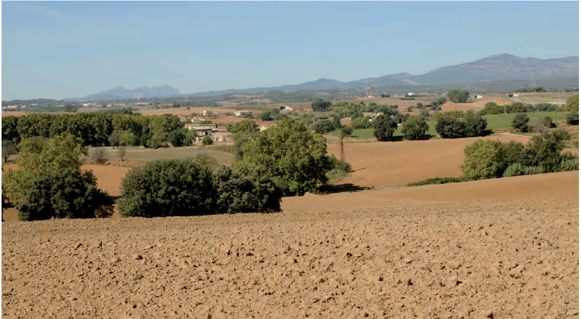
Figura 1. Aspecte de l'Espai Rural de Gallecs on s'observa un paisatge en mosaic format pels diferents camps de conreu, les petites zones amb vegetació natural i les construccions de la pagesia.

vetlli perquè es compleixin les ordenances municipals urbanístiques per tal d'afavorir la seva activitat agrària. Però si aquestes condicions no es donen, aquests espais esdevenen caòtics sense cap mena de disciplina urbanística que els empari. Cal tenir present, en tot moment, que sense la voluntat expressa dels pagesos, no hi hauria l'harmonia paisatgística que els caracteritza. Al pagès se li fa molt difícil mantenir una activitat agrària sota una pressió urbanística subliminal constant, si no hi ha garanties econòmiques de futur que facilitin la seva activitat. Quan observem que l'activitat agrària no té continuïtat i els espais agraris es comencen a abandonar, la fisiognomia paisatgística can-