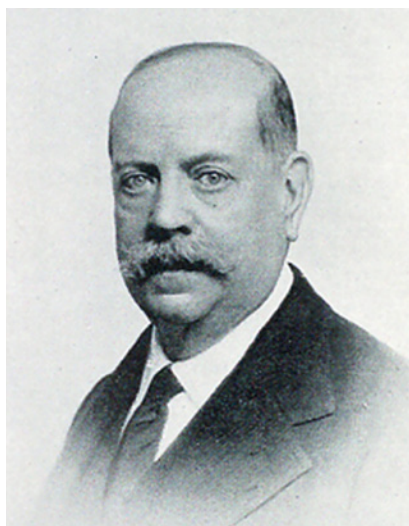
Figura 5. Alfons Sala i Argemí, primer comte d'Egara (Terrassa, 16 de juliol de 1863 - Barcelona, 11 d'abril de 1945), fou un enginyer industrial, advocat i polític català. Fou president de la Mancomunitat de Catalunya, designat pel dictador Miguel Primo de Rivera, entre 1924 i 1925, any que es va dissoldre.