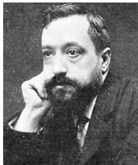
Figura 6. Francesc Pi i Arsuaga (Madrid, novembre de 1865 - Madrid 19 de març de 1912) fou un dramaturg i polític republicà madrileny, fill de Francesc Pi i Margall.

mentats polítics. Sabadell, només per la seva part, va guanyar uns 3.000 nous habitants, unes 50.000 pessetes anuals en concepte d'impostos i nous terrenys per urbanitzar i edificar, tot doblant la seva extensió territorial.