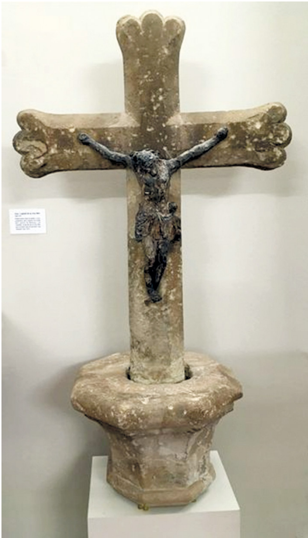
Figura 7. L'antiga creu de la Creu Alta està exposada avui al Museu d'Història de Sabadell. S'hi fa la referència següent: "Aquesta creu va ser encarregada pel Comú de la Vila, l'any 1745, amb la finalitat de marcar el límit del terme de Sabadell amb el de Jonqueres. És una creu de pedra de braços octogonals amb els extrems trilobulats; té adossat un Santcrist de plom amb corona i tres claus. Està disposada sobre una columna de pedra amb capitell i fust octogonals. L'any 1904 amb l'agregació de Jonqueres a Sabadell va perdre la seva funció, però seguí al seu lloc fins el 1933 en què, durant uns aldarulls, la van tirar a terra. Uns veïns de la plaça en recolliren els trossos i la portaren al Museu de Sabadell, on es recompongué i s'instal·là en una de les sales. L'any 1970, amb la remodelació del museu, és traslladà al pati fins que l'any 1987 es reinstal·là a la plaça de la Creu Alta; però l'any 1997, atesa la seva fràgil conservació, es decidí retirar-la de la plaça per restaurar-la i al seu lloc es col·locà la rèplica que hi ha ara, obra de l'escultor Àlex Masalles". La creu original torna a estar exposada actualment a les sales del Museu.

avui— en el subsòl del que va ser el terme de Sant Pere de Terrassa: l'aigua. L'aquífer existent proveïa històricament la ciutat a canvi dels pagaments corresponents als seus propietaris. La mina que proveïa, des de l'antic embassament de Ribatallada a Sant Julià d'Altura, i les mines de Can Llong i de Terrassa, totes pertanyents al municipi desaparegut, asseguraven el subministrament d'aigua necessària; la seva integració al terme municipal va contribuir a reduir els conflictes d'interessos entre propietaris, compradors i arrendataris.