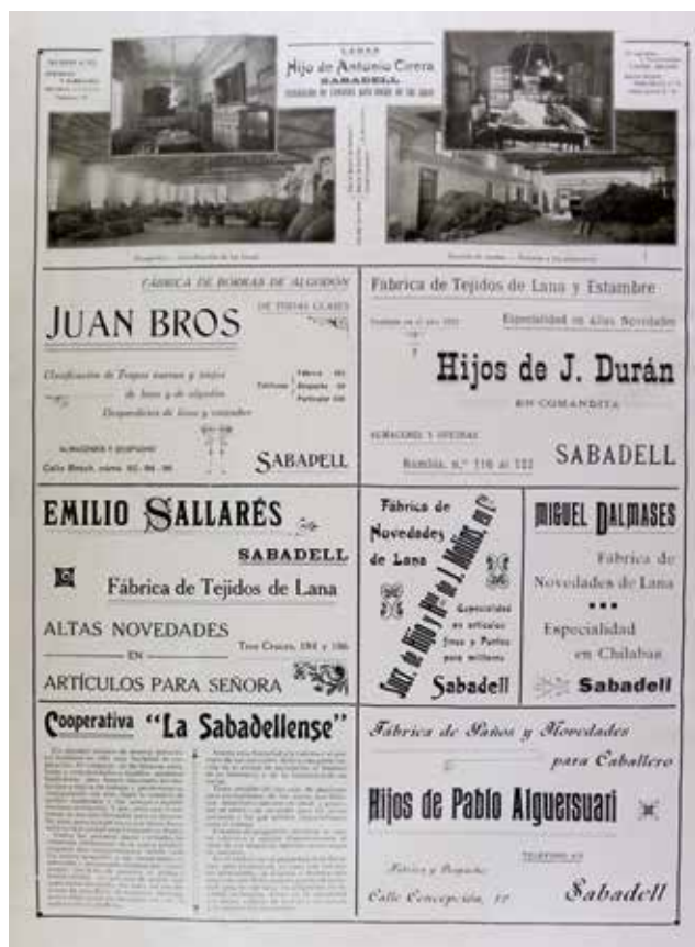
Figura 5. Una de les pàgines d'anuncis d'empreses sabadellenques aparegudes en les planes dedicades a la ciutat de Sabadell dins el volum Maravillas de España , 1916 (AHS).

es podia considerar convenient recórrer a la municipalització d'un servei. L'autor és un clar defensor de la proposta, que requeria personal tècnic competent, especialitzat i independent de la dimensió política dels regidors i d'altres representants polítics.