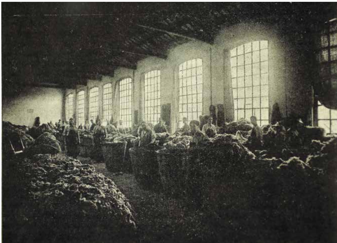
Figura 3. Operaris de la fàbrica Armengol & Cia triant la llana. Sabadell, 1920.

arribar a un acord clau l'any 1911 per reduir la jornada setmanal i establir la setmana anglesa, que reduïa de 65 a 62 hores la jornada setmanal en la indústria llanera. Una regulació local s'avançava així a la regulació espanyola de 1913, que permetria la fixar la jornada laboral en la indústria tèxtil en un màxim de 60 hores setmanals. La interpretació que perfilen els autors va en el camí d'assenyalar que les institucions sabadellenques, en adequar-se millor a la realitat de la ciutat, permeten acords socials més avançats i eficaços (ARÚS, 1915, p. 302-302).