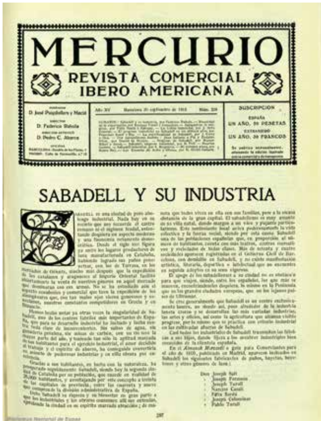
Figura 1. Primera plana del número de Mercurio: revista comercial hispano-americana dedicada a Sabadell, núm. 238 (30.09.1915).