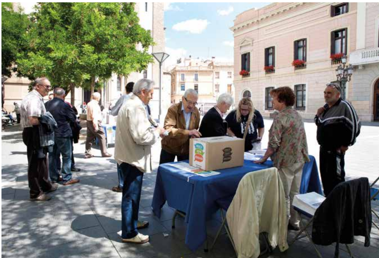
Figura 10. Multireferèndum del 23 de maig de 2014. Mesa electoral. Autor: Isidre Tiana

obertes a entitats i persones interessades, i també es van organitzar debats al voltant de les qüestions sobre les quals es demanava que la ciutadania es pronunciés i es van elaborar materials explicatius relacionats amb cada qüestió plantejada.