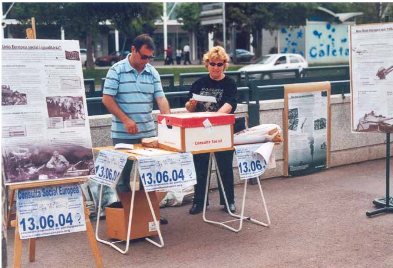
Figura 7. Mesa per votar en la Consulta Social Europea al Parc Catalunya, 13 de juny de 2004.

urnes. Una setmana més tard es van tornar a constituir les meses i es va repetir la Consulta, però tot plegat va fer que la participació fos menor.