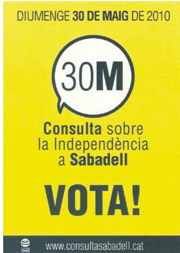
Figura 9. Cartell de la Consulta sobre la Independència a Sabadell.

Es va permetre votar a partir dels 16 anys i a totes les persones, també immigrants amb NIE o passaport del país d'origen. Es va preveure la possibilitat de votar anticipadament a partir del 23 d'abril. La pregunta era: