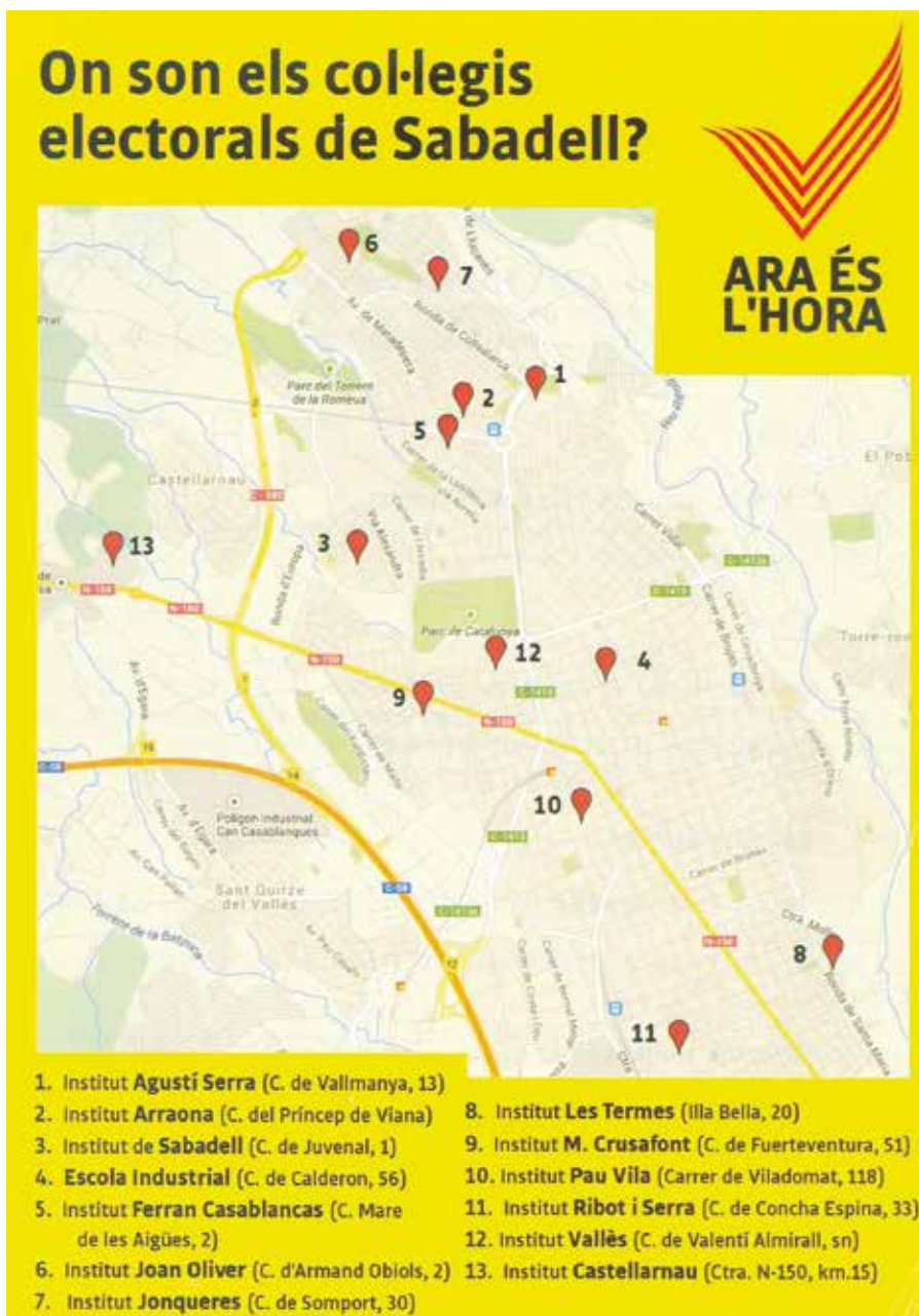
Figura 12. Fullet de la consulta del gN, on s'indicaven els col·legis electorals.

nes diverses a Sabadell per poder realitzar exercicis de democràcia directa, d'enxarxar-se i de decidir sobre coses que ens afecten directament; en definitiva, d'exercir la sobirania que rau en cada persona.