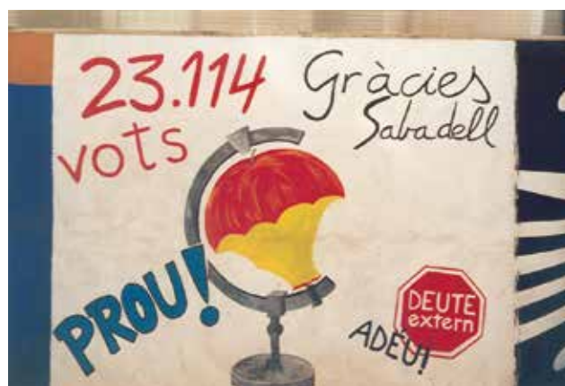
Figura 6. Pintada al Passeig de la Plaça Major amb el resultat de la consulta del Deute extern, any 2000. Autora: Teresa Tuset.

necessitat de participació, protagonisme i corresponsabilitat que demana cada vegada més la ciutadania. Volem participar dia a dia i entenem que sense poder de decisió no hi ha una veritable participació.