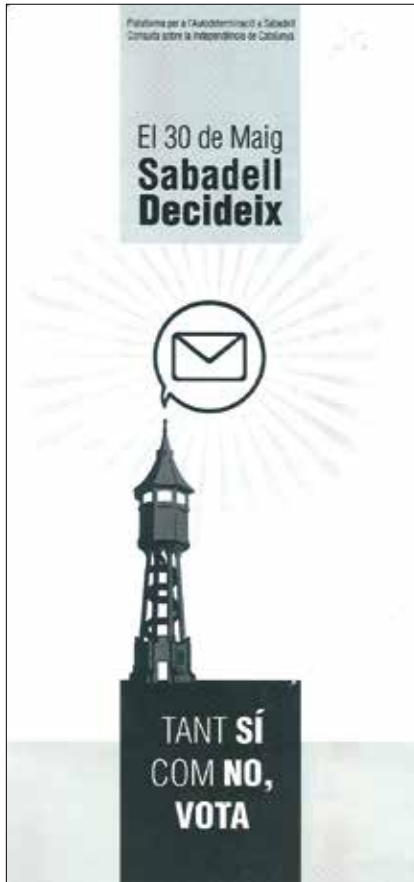
Figura 8. Tríptic de la consulta de Sabadell Decideix.