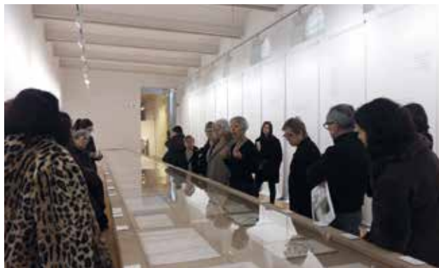
(Museu d'Art de Sabadell)

descreació que va deixant al descobert, nua, la part impersonal que hi ha en tota subjectivitat humana. La renúncia a la perspectiva individual i a l'art com a expressió és el passatge que tria Fina Miralles per anar en cerca d'un llenguatge primordial, comú a tots els humans i a totes les cultures. Intemporal, universal, transmissor de l'ànima humana. La renúncia a la imaginació com a quelcom que és propi del "jo" té com a contrapartida un florir de les imatges que tant poden arribar de lluny, del temps fora del temps de tradicions llunyanes, els mites i les religions, com d'estats d'inspiració en què es produeix un intercanvi entre la realitat espiritual i la realitat corporal, terrenal. Renunciar a la imaginació, crear el buit intel·lectual per obrir-se als sabers de l'esperit. Silenci interior, estat d'espera i atenció extremes fins que arriben el traç, el moviment i les imatges amb entitat pròpia, irrenunciabls, immodificables. L'univers visual de Fina Miralles creat a través del dibuix i la pintura al llarg dels anys 80 i 90 s'inicia amb aquesta confiança en la capacitat de coneixement transcendent que arriba des