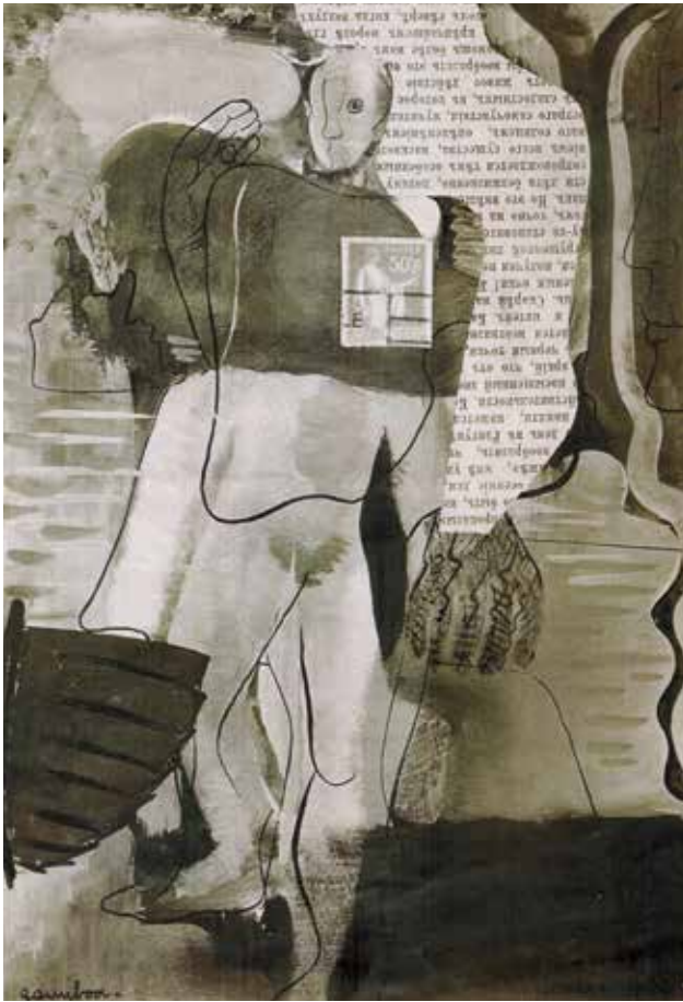
Composició surrealista, c. 1936.

gener de 1936. Éluard venia a donar unes conferències que serveixen per contextualitzar l'exposició de Picasso a Barcelona, patrocinada per Amics de l'Art Nou (ADLAN). El poeta francès va tenir oportunitat de posar-se en contacte amb un grup de joves artistes que s'aplegaren amb el nom de "logicofobistes". El projecte havia de tenir una exposició a Barcelona, que després es podria veure a Madrid i a Tenerife.