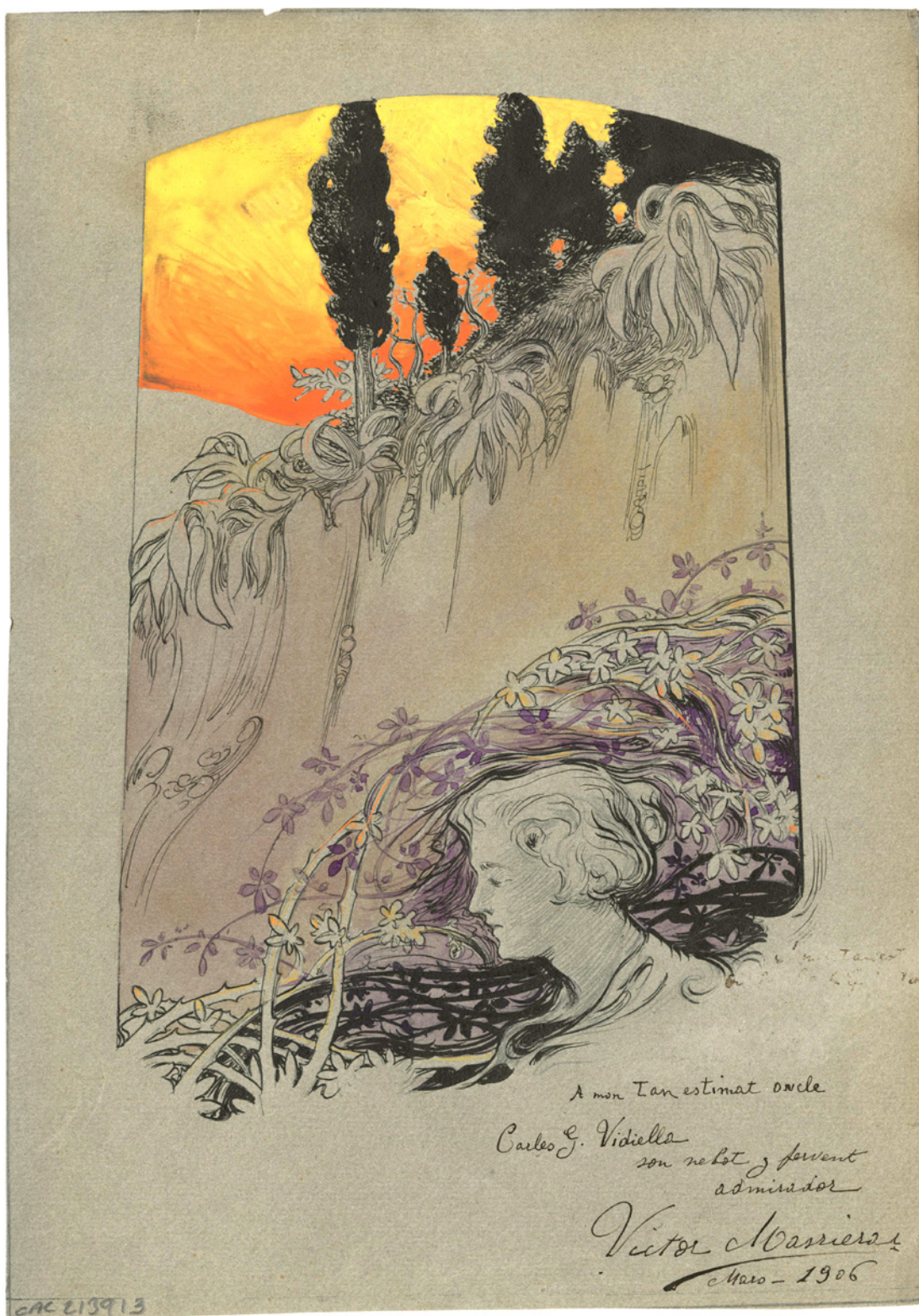
Figura 1. Il·lustració de Víctor Masriera dedicada al seu oncle polític, Carles Gumersind Vidiella, 1906. (ANC. Fons Víctor Masriera-famílies Masriera-Ferrer. Inv.170. CAC 213913).