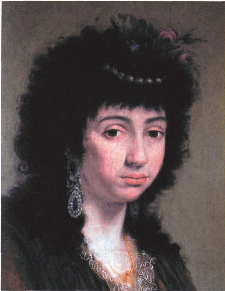
Fotografia 5. Detall del procés de neteja. Fotografia: Montserrat Puchades.

havia pèrdues de capa de preparació i de capa pictòrica coincidents amb els forats del suport, així com en altres zones de la tela, especialment a la part superior esquerra. A més de l'envelliment del vernís, l'obra presentava molta pols uniforme a tota la superfície, restes d'excrements d'au i taques de gotes direccionals. S'acordà no intervenir en el marc, que era contemporani, de producció industrial, i que es retirà de l'obra.