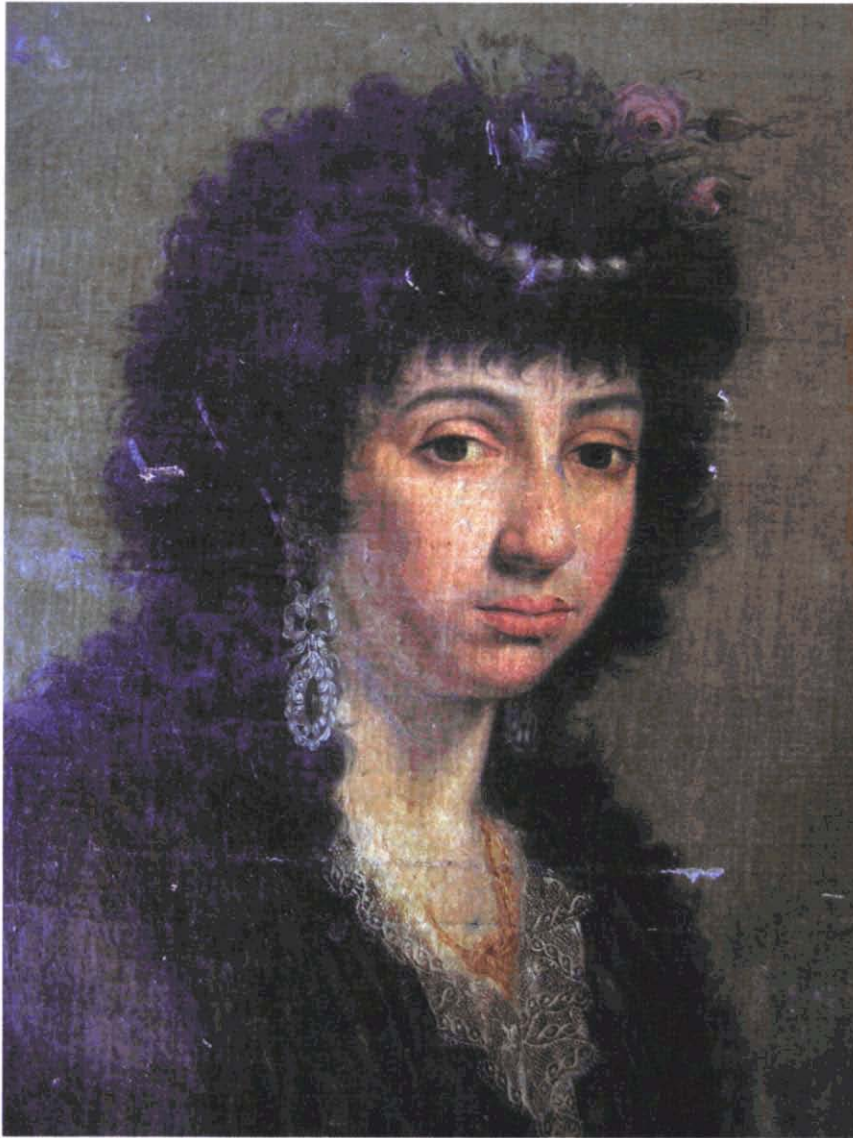
Fotografia 4. La Brodadora abans de la intervenció.