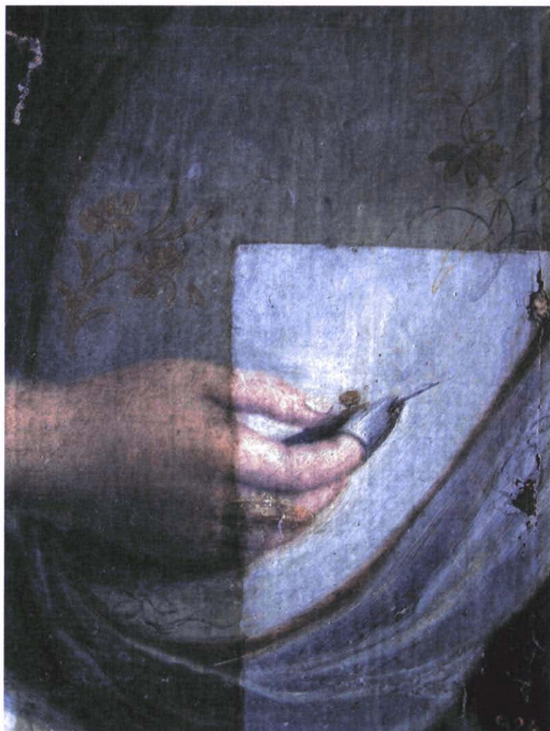
Fotografia 6. Detall del procés de neteja .

en perill la integritat de l'obra. Per tant, es decidí fixar la tela en les zones on estava més disgregada, mitjançant un adhesiu en pols amb aplicació d'escalfor, i a les zones on s'havia perdut part del suport s'adheriren empelts de protecció de teixit no tramat, enganxats amb adhesiu d'acetat de vinil etilè i resines acríliques en film activat amb escalfor. La superfície pictòrica es netejà amb dissolvent de tipus aromàtic saponificat, aplicat amb hisop, i per a la reintegració es trià un vernís Dammar, pel seu acabat setinat. Les pèrdues s'anivellaren amb estuc preparat i aigua destil·lada i, com en el cas anterior, la reintegració pictòrica fou de tipus il·lusionista, amb pigments i white spirit . S'hi aplicà una capa final amb vernís de retoc en esprai.