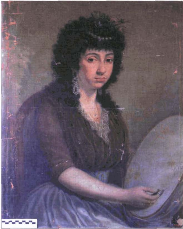
Fotografies 1, 2 i 3. La Brodadora abans de la intervenció, durant el procés d'estucat i un cop finalitzada la restauració.