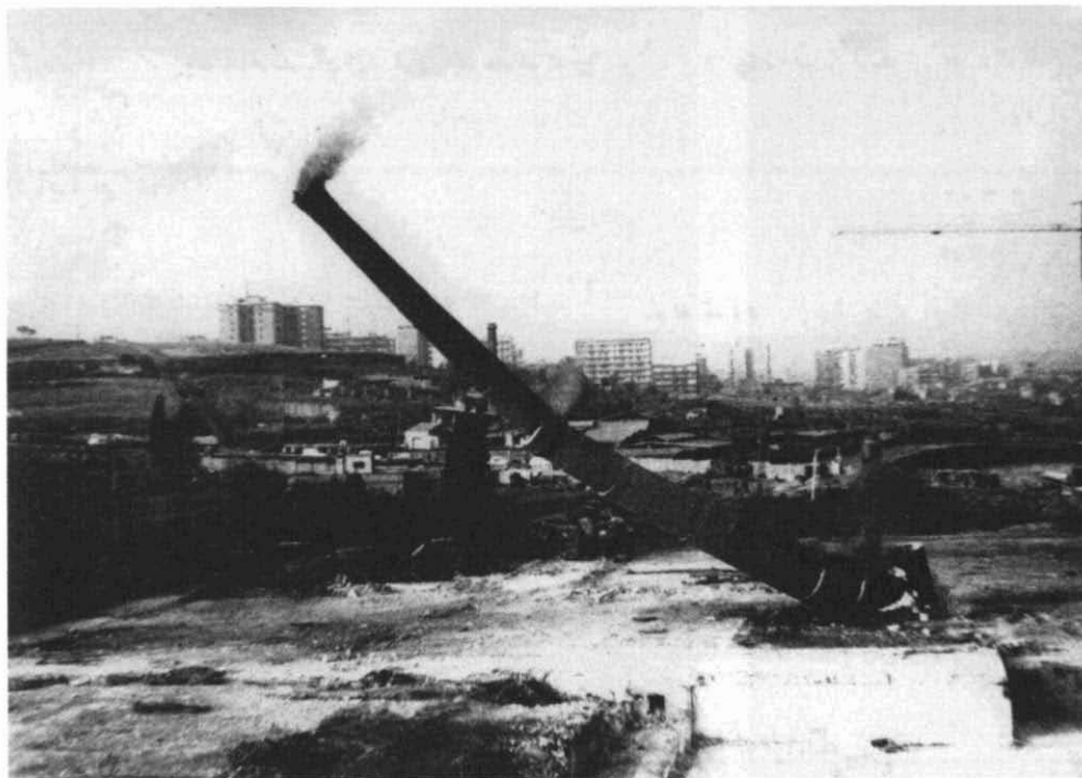
Fotografia 4. Enderroc de la xemeneia de cal Jepó nou (Prat, Carol i Companyia). Tardor de 1973. Autor: Pere Vidal i Miquel. (AFUES).

hi ha hagut noms que s'han confirmat, però també n'hi ha que s'han hagut de desdir: inco-reccions, precisions gràcies al fet que se n'ha pogut esbrinar la data de construcció (és a dir, s'ha sabut el nom de l'empresa que la va fer aixecar), verificacions amb documentació original d'arxiu... Per exemple: Fytisa (no vapor d'en Folguera o Valentí Casas), Tints i Aprestos Casanovas Argelaguet (no molí de l'Oriac), Indústries Auxiliars Casablanques (no vapor de la O), etc. Totes elles, a més, s'han posat sobre el mapa de la ciutat i s'han identificat tipològicament.