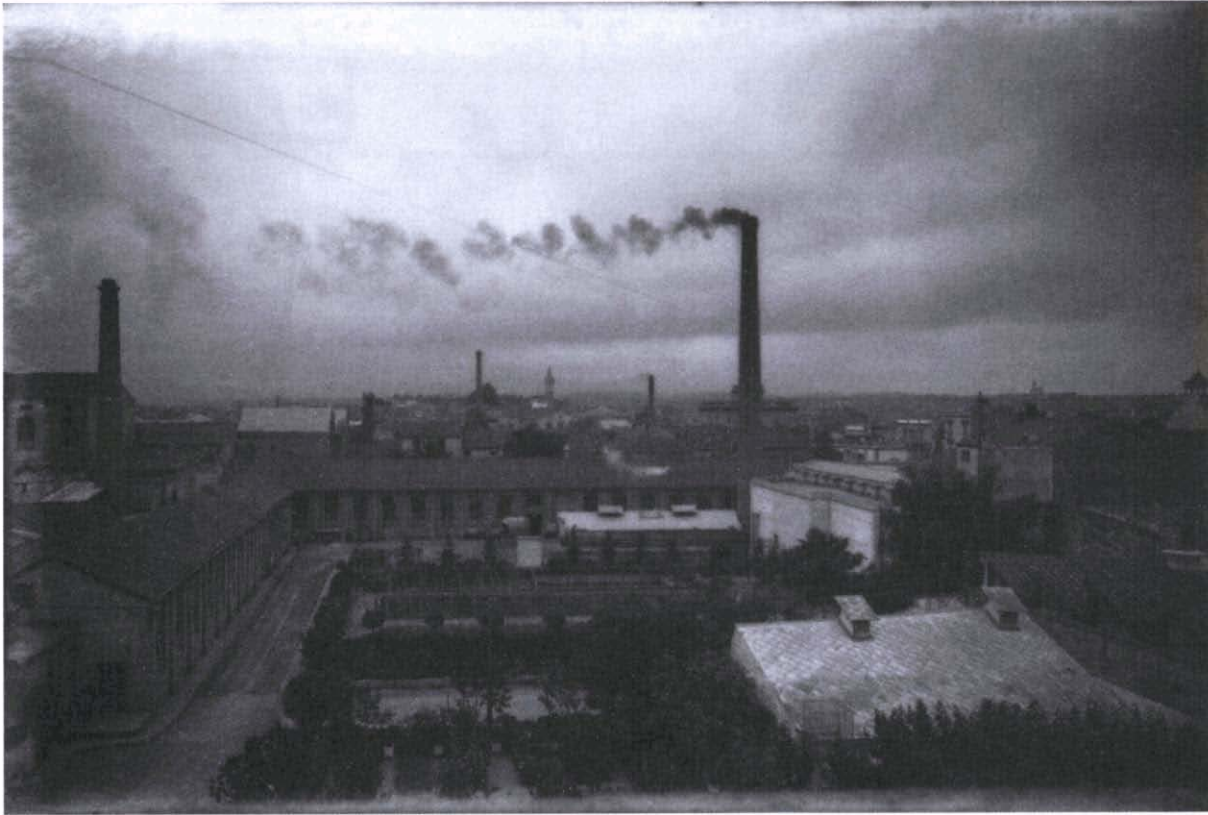
Fotografia 1. La xemeneia de la fàbrica de Francesc Sampere i Germans, en ple funcionament. Anys 1920. Autor: Francesc Casañas. (AHS).

Per acord de la Junta del Patronat de la Fundació Caixa Catalunya, amb data de 12 de febrer de 2004, al projecte se li atorgà un ajut per import de 14.700 €. Amb data de 17 de juny de 2004 se signà l'Acord de col·laboració entre la Fundació Caixa Catalunya i l'OAM Museus Municipals de Sabadell (Museu d'Història de Sabadell) per desenvolupar-lo. El cost total del projecte s'havia valorat en 29.419,53 €.