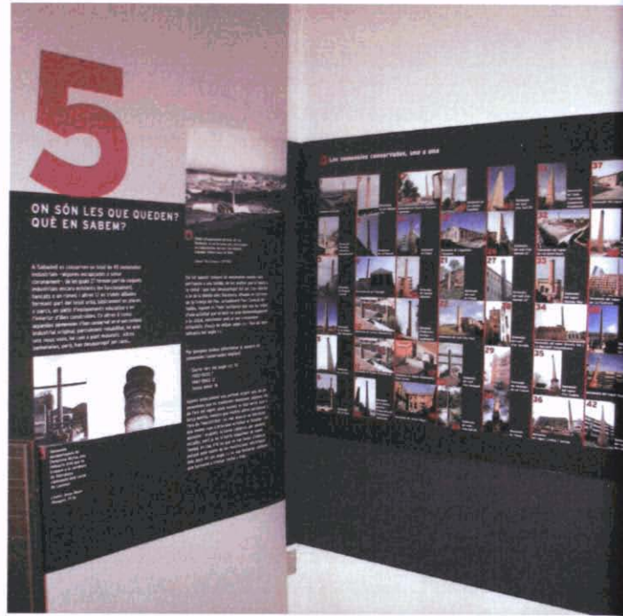
Fotografies 5 i 6. Diferents detalls del muntatge de l'exposició instal·lada al MHS, 2007.