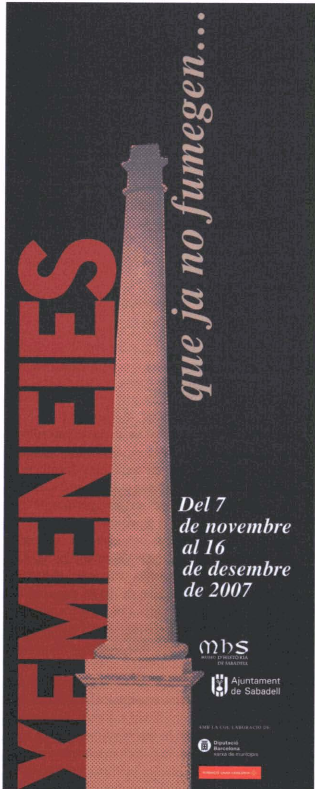
Figura 1. Imatge gràfica de l'exposició, dissenyada per Pere Fradera.