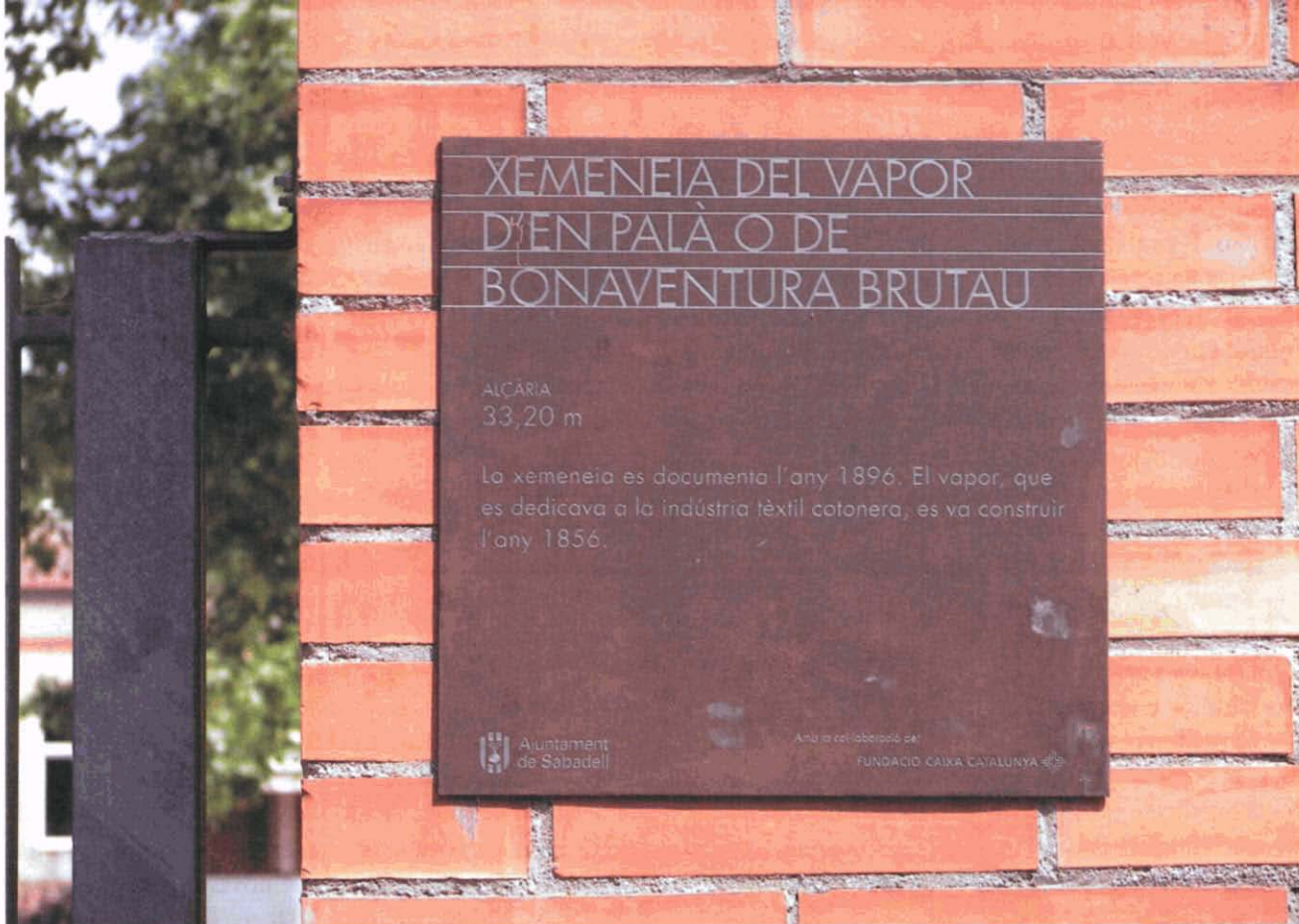
Fotografia 3. Placa de paret que senyalitza la xemeneia del vapor d'en Palà o de Bonaventura Brutau, actualment situada al pati del CEIP Joanot Alisanda, 2007. (MHS).

— El mes de maig del 2006 s'encarrega la producció de les set primeres plaques a l'empresa Cèl·lula.