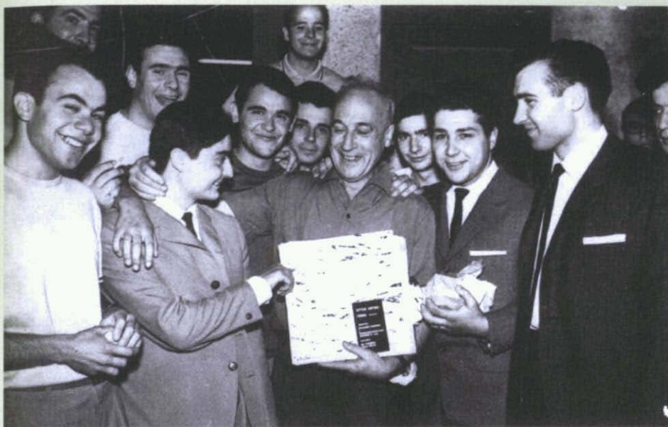
Fotografia 4. Fi de curs de l'any 1968.