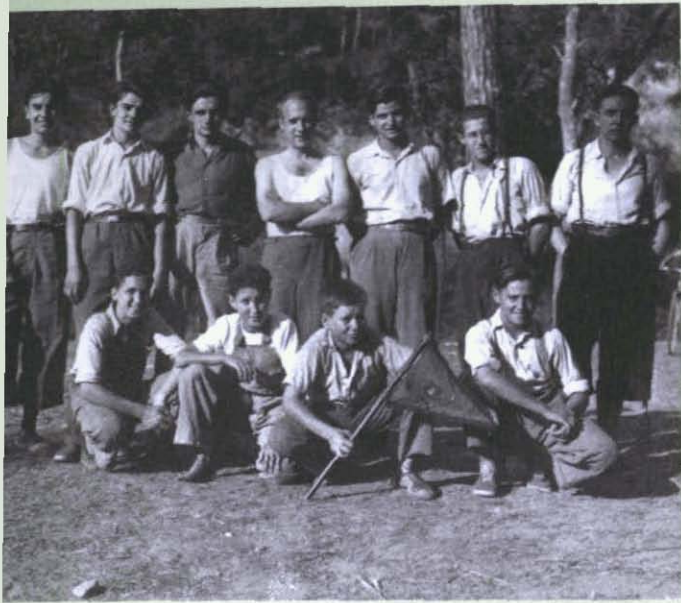
Fotografia 3. Promoció de l'any 1958.