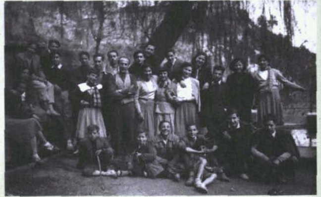
Fotografia 2. Promoció de l'any 1956.