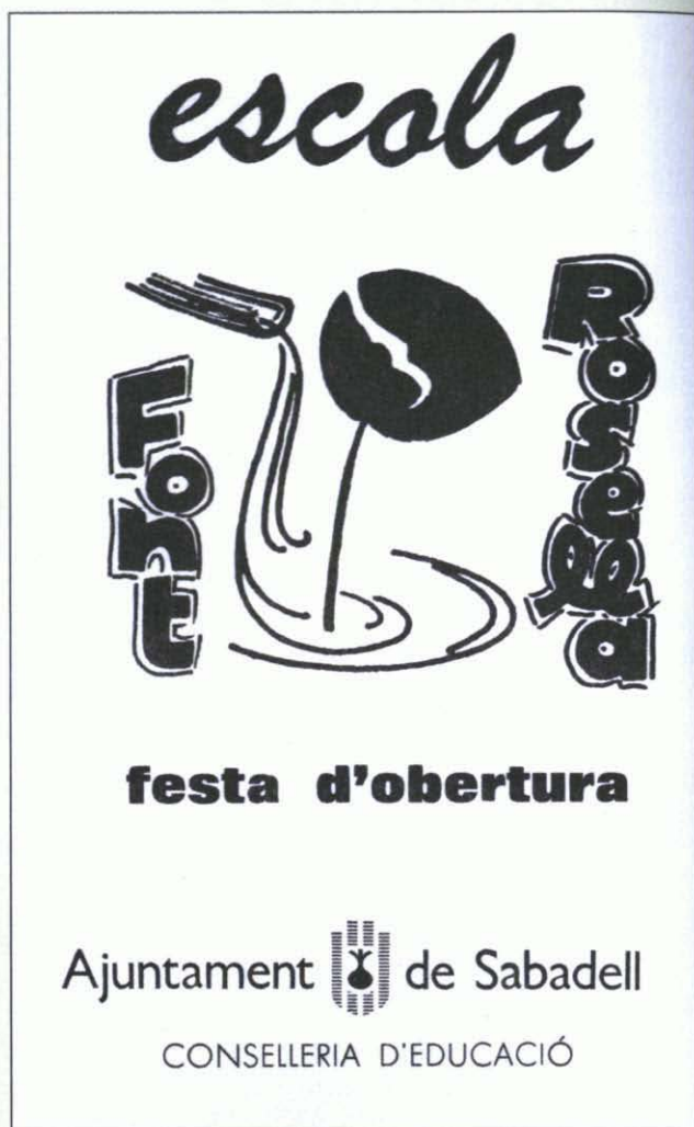
Figura 3. Programa d'inauguració de l'escola Font Rosella, 1982. (AHS).

Quan la Generalitat va crear els Centres de Recursos Pedagògics per a tot Catalunya, el plantejament va ser molt similar al del SMRRP. Sembla que qui va elaborar la proposta d'aquells centres, abans l'havia analitzat detingudament. A Sabadell, estaven en el mateix espai físic i es treballava conjuntament.