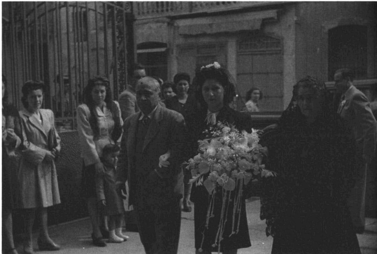
Fotografia 8. Núvia sortint cap al casament. Família sense identificar, residents al c. de Regàs, 1. Sabadell, 4 de maig de 1947. Autor: Joan Balmes i Benedicto (C25- R287- Foto 04).

cos durs de 400 Gb, amb una ocupació total de prop de 2 terabites, és a dir, 2.000 Gb. El temps d'execució de la digitalització es preveu d'uns 4 a 6 mesos, mentre que la documentació pot ocupar uns dos anys si es disposa del personal necessari per afrontar aquesta tasca.