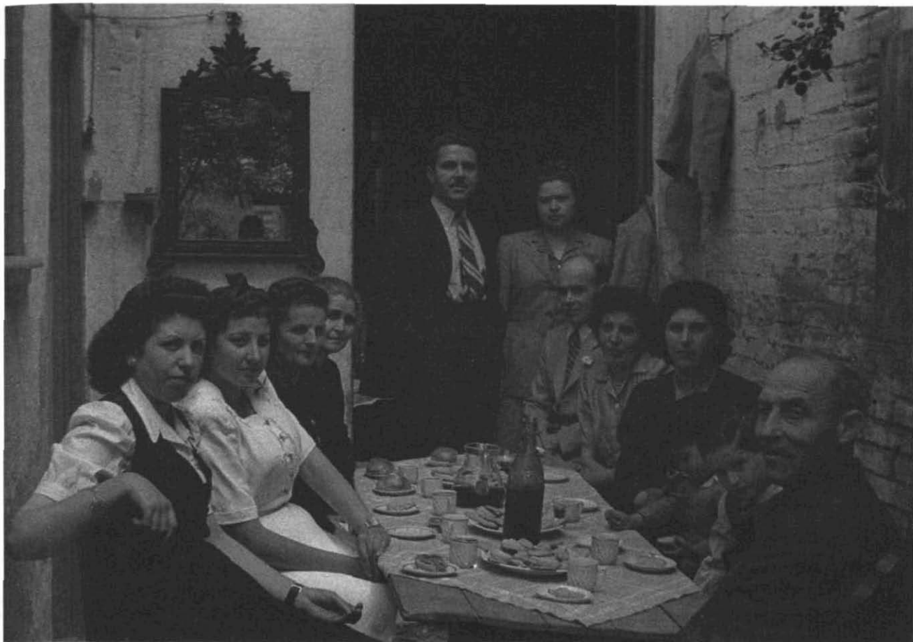
Fotografia 7. Celebració del casament al pati de la casa. Família sense identificar, residents al c. de Regàs, 1. Sabadell, 4 de maig de 1947. Autor: Joan Balmes i Benedicto (C25- R287- Foto).

requeriments tècnics d'aquesta tasca obliguen a treballar amb empreses especialitzades, tant pel volum de documents com per l'especificitat de la digitalització. Alguns d'aquests requeriments són: