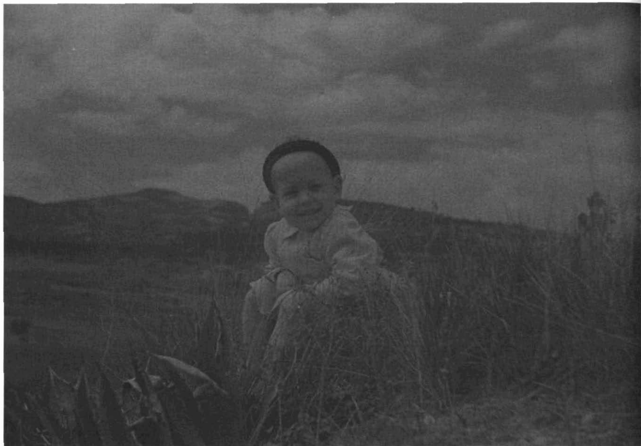
Fotografia 4. "Martí amb el cap pelat". Retrat del fill de Joan Balmes a Sant Llorenç del Munt. 20 d'abril de 1947. Autor: Joan Balmes i Benedicto (C25- R283- Foto 30).

— Per la cronologia i la temàtica que tracta, aquest fons omple un buit documental en les col·leccions fotogràfiques que actualment té la Secció d'Imatge i So de l'Arxiu Històric de Sabadell. La fotografia amateur dels anys 1936-1939, tal com hem dit abans, és poc habitual. D'altra banda, després de la guerra civil es van frenar, entre d'altres activitats culturals, la fotografia, el cinema i tota mena de manifestacions artístiques i creatives lliures. L'Estat, en passar de ser laic a ser confessional, dirigeix la producció mediàtica vers la propaganda oficial del règim i les activitats de les institucions afins, com ara l'església catòlica. A partir de 1939 desapareix la fotografia tal com se la coneixia abans, tant per la penúria econòmica com per la censura general imposada a la ciutadania. Tenir una col·lecció ben organitzada que documenta la vida social, cultural i reli-