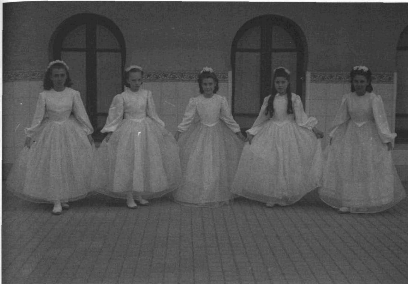
Fotografia 5. Alumnes de les Mares Escolàpies durant la celebració del centenari de la congregació. Sabadell, 14 d'abril de 1947. (C25- R281- Foto 34).