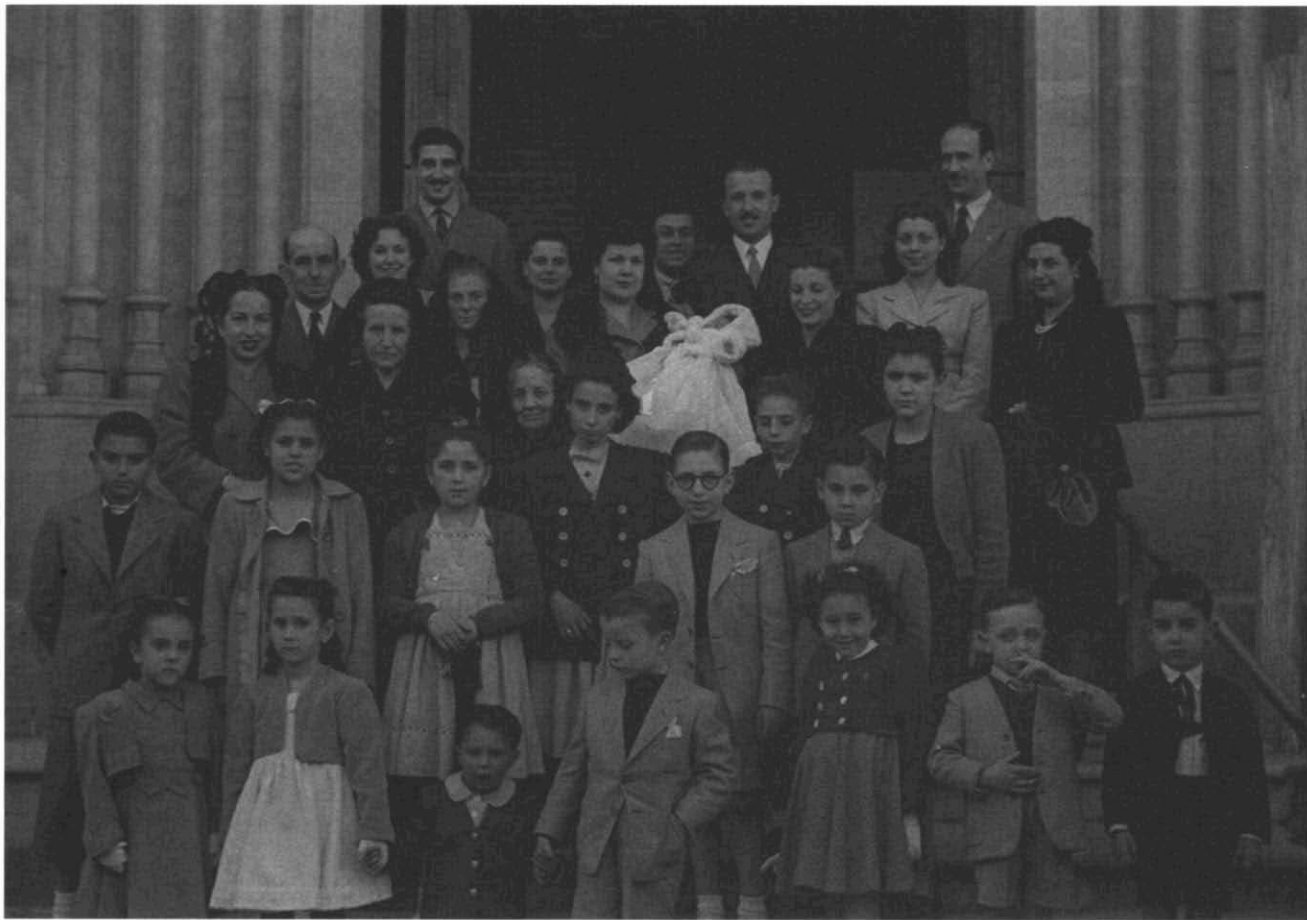
Fotografia 6. Grup familiar amb un nadó a la sortida del bateig. Família sense identificar, residents al c/ de les Tres Creus, 87. Sabadell, 26 d'abril de 1947. (C25- R285- Foto 01).

ductes de tota mena, que a Espanya va durar fins més enllà del 1950, afegia dificultats a l'hora d'adquirir material fotogràfic, el qual no era pas un producte de primera necessitat. Els negatius de pas universal es conserven en rodets sencers i estan tots inventariats. Cada rodet està embolicat amb paper de cel·lulosa en què hi ha escrit l'interval amb els números extrems de negatiu dins del rodet. La tira de negatius té anotat al marge i amb tinta el número que correspon a cada negatiu. Aquesta numeració està anotada en un inventari que l'associa amb la descripció i la data del reportatge.