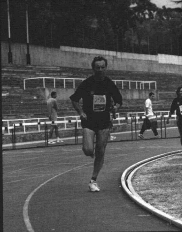
Fotografia 7. Intent de rècord Guinness de la Joventut Atlètica Sabadell del relleu 100x400 masculí. Pistes de Sant Oleguer, 15 d'octubre de 1995. (Arxiu Josep Molins).