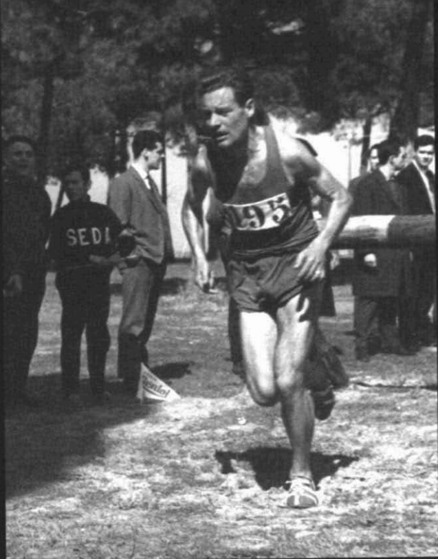
Fotografia 6. Cross de Sant Sebastià al bosc de Can Deu, any 1958.