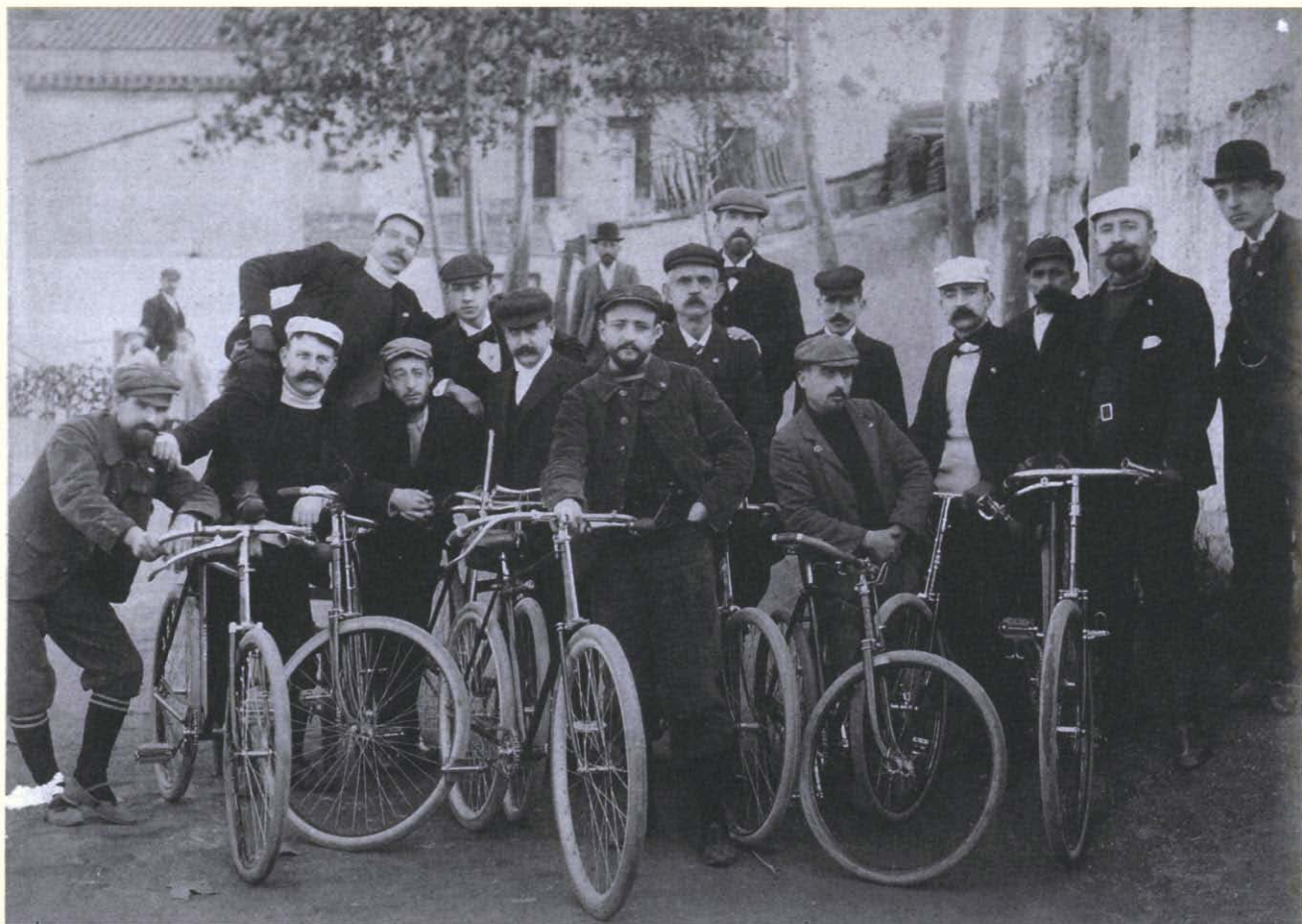
Fotografia 1. Integrants del Club Velocipédico Sabadellés. Sabadell, desembre de 1897.

època de prejudicis en què s'iniciava l'actual segle, que tots uns senyors de casa bona —un metge, diversos fabricants, teòrics i comerciants— juguessin a pilota imitant la quixalla?». 2