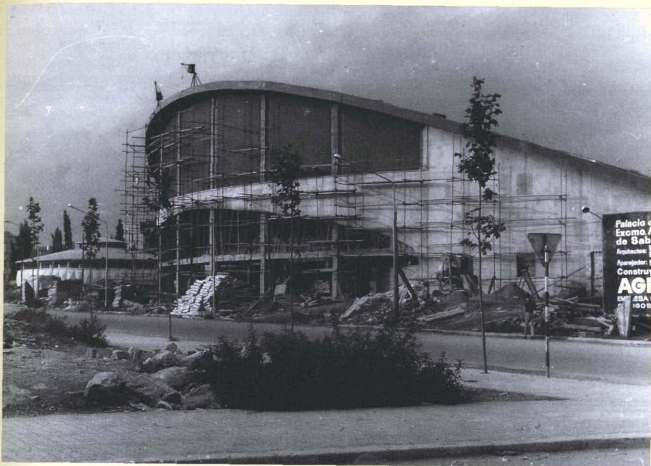
Fotografia 5. Obres al Palau Municipal d'Esports. Sabadell, 29 d'agost de 1970. Autor: Pere Farran (AHS).

les pistes d'atletisme del pla dels Cartrons a Sant Oleguer i, el 1966, una nova piscina municipal de mides olímpiques i amb torre de salt. L'any següent, marcat per l'èxit del retorn a primera divisió, el Centre d'Esports Sabadell inaugura la Nova Creu Alta. I el 1970 obrí les portes el flamant i modern Pavelló Municipal d'Esports.