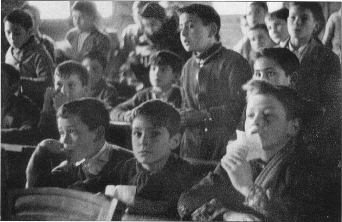
FOTOGRAFIA 2. Nens de Torre-romeu a l'escola de la barraca de fusta. Fi de la dècada de 1950..

Simplement per sobreviure, per estalviar diners per comprar un solar i edificar una barraca, tots els membres de la família sense distinció treballen unes jornades llargues i fatigoses que no deixen cap possibilitat de dedicar temps a d'altres quefers.