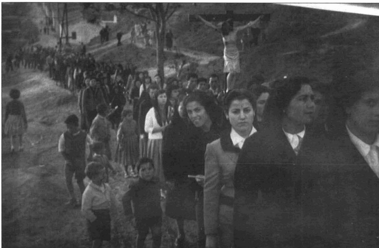
FOTOGRAFIA 3. Setmana Santa a Torre-romeu, 1957.

hacía de comer. ¡Corre que te pilló! Y después otra vez “pa” arriba a hacer otras cuatro horitas y después ya me venía y como mi hija ya era grandecita con siete añillos, cuidaba de los dos pequeños. Cuando vinimos para acá, pues levantarnos temprano a las 4 de la mañana y irnos a trabajar, y dejar nuestros hijos aquí en casa y a la mayor aconsejarle: peina y lava a tus hermanitos y al colegio. ¡Que cuando venga quiero saber que has ido al colegio! Y después por la tarde, pues ídem de lo mismo. Hasta que se hicieron grandes y ya fue otra etapa. Ya entonces ellas iban a trabajar y yo me quedaba en casa. Él trabajaba fijo pero yo trabajaba haciendo horas aquí en Sabadell, pero no estaba reconocida porque en aquellos tiempos, Franco, la mujer del metalúrgico no podía hacer horas ni fatigas. O sea que iba de pirata para tirar a mis hijos, porque con lo que él ganaba tampoco lo podíamos sacar adelante y había de sacar a mis hijos. Yo he trabajado a 4 pesetas la hora haciendo rodetes, y he “trabajao” a dos