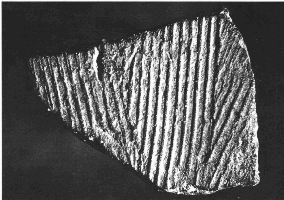
FOTOGRAFIA 1. El fragment ceràmic.