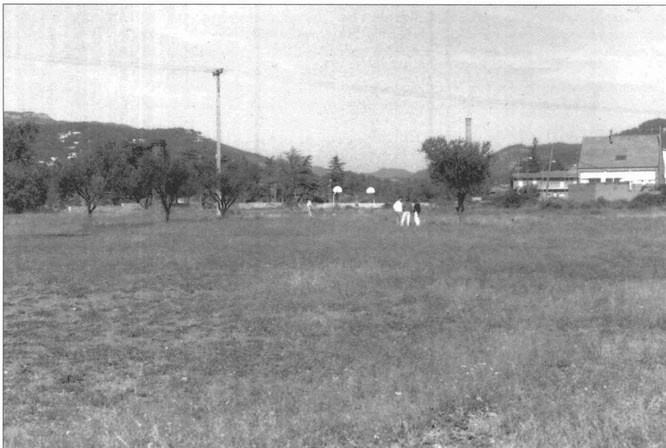
FOTOGRAFIA 3. El Pitu de Can Barba.

El Molí d'en Busquets (mapa 1) és la zona situada a la banda esquerra del riu. Es tracta de camps de conreu, dels quals es van prospectar uns 30.000 m 2 . No s'hi recolliren materials d'època ibèrica.