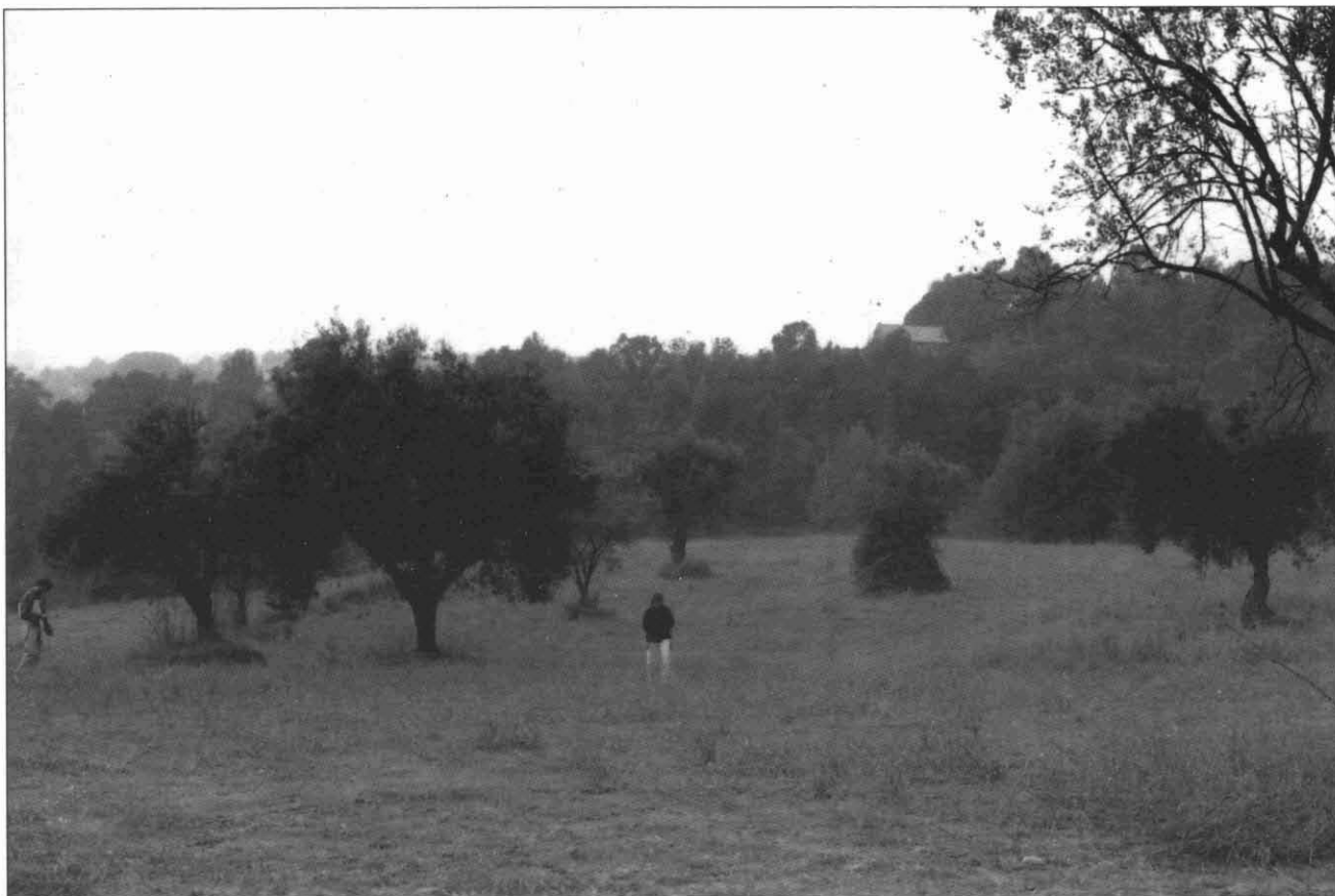
FOTOGRAFIA 2. Can Sallent .

Can Riera (mapa 1) també es troba situat a la carretera C1415, a l'alçada del camí que porta al Castell de Castellar. No es van poder prospectar les terrasses que formen els camps de Can Riera, i que es dediquen al conreu d'arbres fruiters, ja que estan encerclats de tanques. En aquests camps s'havien recollit alguns fragments de ceràmica ibèrica.