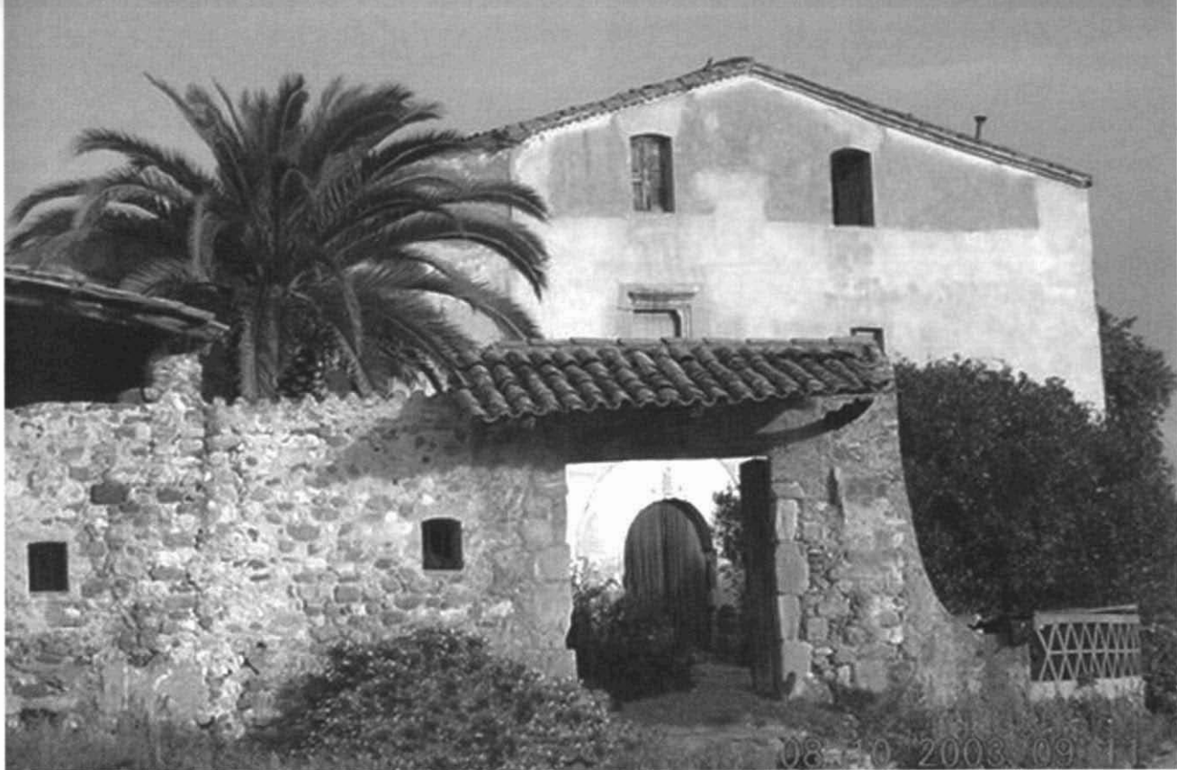
Fotografia 1. Masia de Can Cladelles , any 2003. Autor: Esteve Canyameres.

per documents que pertanyen i que, per tant, cal adscriure als seus respectius fons (cas dels pergamins de l'antiga Universitat, de la Comunitat de Preveres de Sant Feliu o del fons Arnella-Gai), o que per ells mateixos constitueixen un fons. Aquest darrer cas seria el corresponent als pergamins de Can Cladelles. Potser per acabar d'entendre el sentit de tot això citarem dos casos reals. Per exemple, els pergamins dels fons Duran del Pedregar o de Can Colomer de Santa Perpètua, ingressats els darrers anys a l'AHS, no s'han classificat i catalogat amb la col·lecció de pergamins, sinó juntament amb la resta de documentació en suport paper de cadascun d'aquests fons. Per contra, altres pergamins solts lliurats a l'AHS per diversos particulars, sí que s'han integrat a la col·lecció de pergamins.