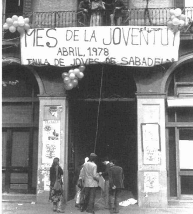
Fotografia 2. Casal de Joves Pere Quart, abril 1978.