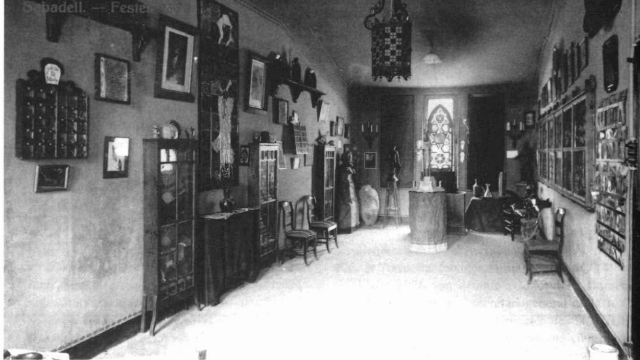
Fotografia 4. Detall d'una dependència de la seu del Cercle Republicà Federal, l'any 1920. Es tracta d'una petita sala amb l'exposició d'una miscel·lània d'obres d'art, elements decoratius, peces arqueològiques (?), mobiliari, etc., a la manera d'un petit museu. Podria ser l'únic testimoni gràfic del saló museu del qual s'ha conservat l'inventari descrit en aquesta nota. Autor: Francesc Casañas Riera (Arxiu Històric de Sabadell).

secció excursionista del Cercle, el Brot Vallesenc, amb una ideologia certament àcrata i naturista. 29