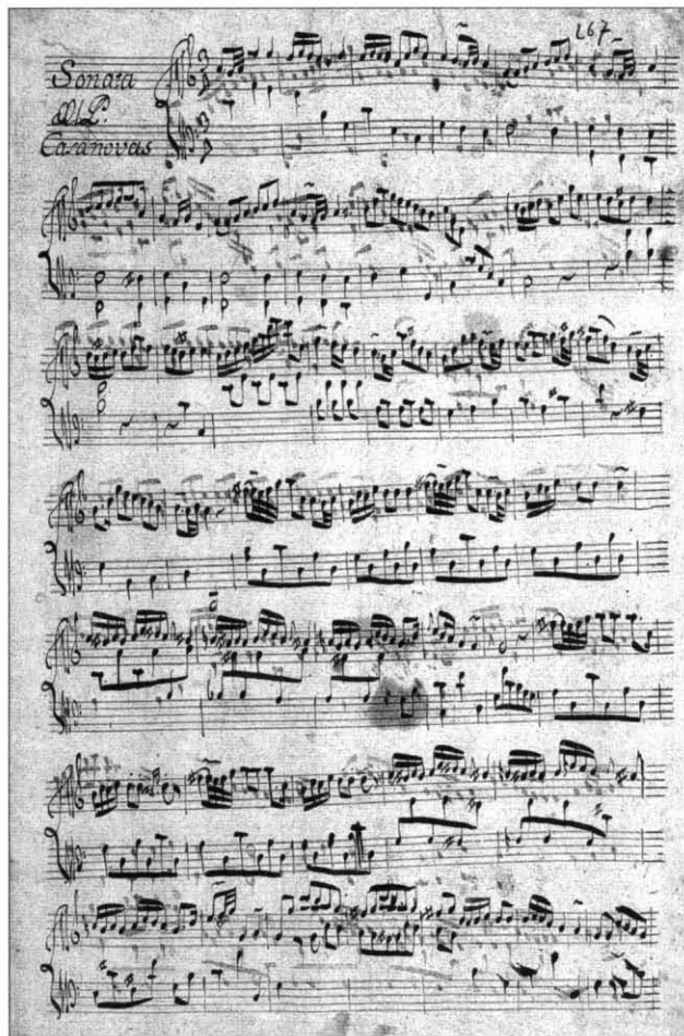
FIGURA 3. Còpia manuscrita de la primera pàgina de la Sonata número 3, segons el ms. 84 (Arxiu de Música de Montserrat).

A partir dels dos volums de Mestres de l'Escolania (MEM) en què es publiquen totes les obres de Casanoves per a teclat, podem ara establir detalladament tota l'obra d'aquest compositor i organista: