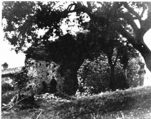
Ermita de Sant Salvador dels Prats.