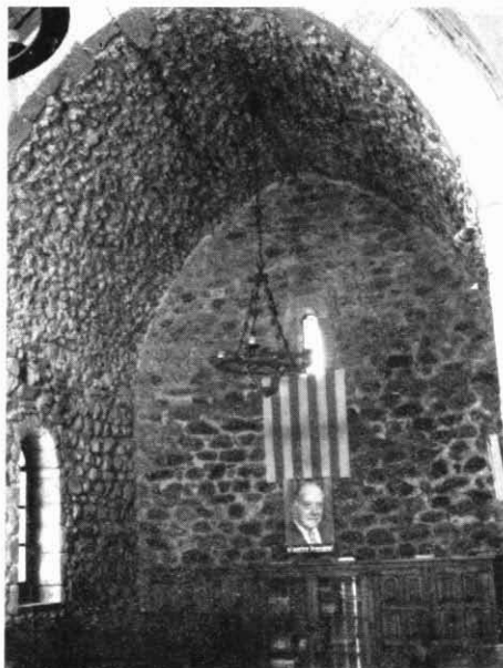
Façana i interior de Sant Corneli.