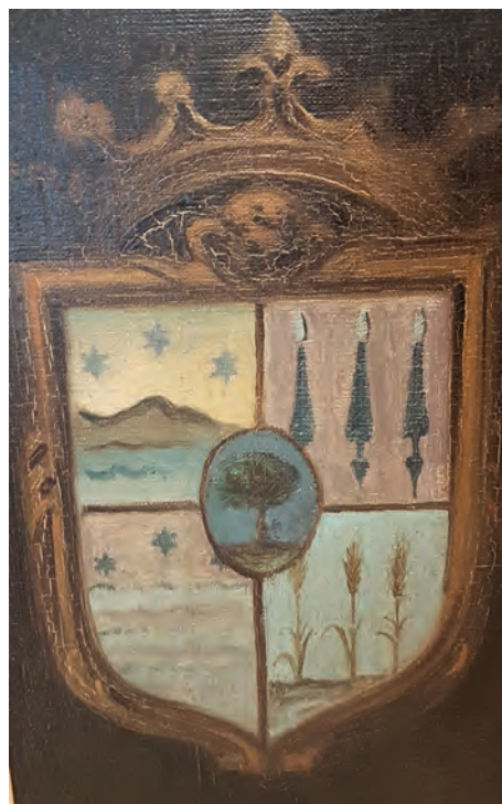
Imatge 22. Detall de les Armes del Retrat.