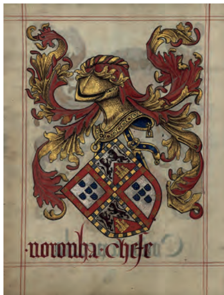
Imatge 6. Armes del llinatge Noronha.

bordura de gules amb vuit castells d'or, que és Portugal i Castella; i els 2n i 3r, d'argent, dos lleons d'or (o atzur segons el de Noronha), gaiat curvilini a la punta de gules amb un castell d'or, i una bordura de gules componada de vuit castells d'or, que és Noronha. Pel que fa al seu timbre, no s'aprecia la creu. Tampoc s'aprecien els cordons i les borles al capell de sinople. Com a suports presenta un parell d'àngels ( Imatge 5 ). Ara bé, en l'escut propi de la família Noronha sembla que els seus quaters 2n i 3r no són idèntics als del bisbe, ja que aquells són d'argent, dos lleons d'atzur i no d'or ( Imatge 6 ).