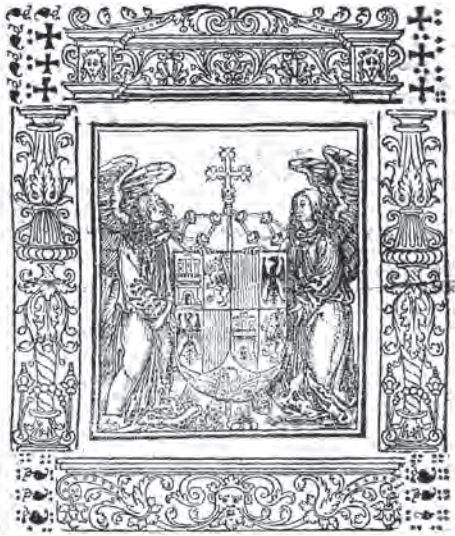
Imatge 2. Armes d'Alfons d'Aragó.