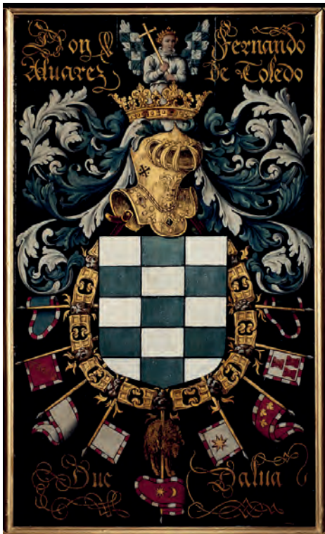
Imatge 10. Armes de Fernando de Toledo.

En tot cas les seves armes serien les del seu pare, amb alguna brisura que no he trobat, de manera que fem constar aquí les armes del seu pare Fernando Álvarez de Toledo y Pimentel, tercer duc d'Alba, les quals consten a la catedral de Gant a Bèlgica a la reunió de l'orde del Toisó d'Or en aquesta població l'any 1549, que són: escacat de quinze peces, vuit d'argent i set d'atzur ( Imatge 10 ).