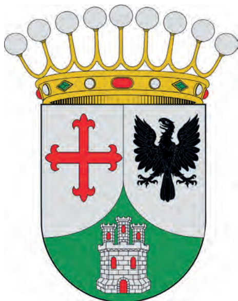
Imatge 17. Armes del Comtat de Puñón-Rostro.