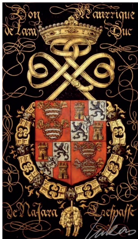
Imatge 33. Armes d'Antonio Manrique de Lara.

torre mestra, sostinguda per dos lleons recolzats a cada costat de la torre ( Imatge 32 ).