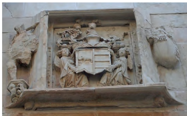
Imatge 7. Armes dels Borja de Gandia.

Les armes d'aquest polític, i més tard eclesiàstic catòlic, les trobem entre d'altres llocs a la façana principal del palau ducal dels Borja, a la ciutat de Gandia, en una fornícula flanquejada per dos homes de barbes. L'escut està sostingut per dos tenants que són dos àngels custodis amb el seu significat de fidelitat, coronat per una corona ducal amb una cimera que conté un lleó. L'escut és partit en pal, el primer quarter d'or, un bou passant de gules terrassat de sinople, que és el llinatge Borja, i el segon quarter faixat d'or i sable, que és el llinatge Oms-Fenollet ( Imatge 7 ). L'escut dels Borja de Gandia es troba també en una de les mènsules del claustre del monestir de Sant Agustí de Barcelona, lloc on va residir quan era virrei. Es tracta del mateix escut partit en pal, abans esmentat ( Imatge 8 ).