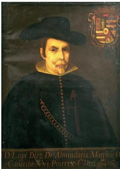
Imatge 26. Retrat de Lope Díez d'Aux.