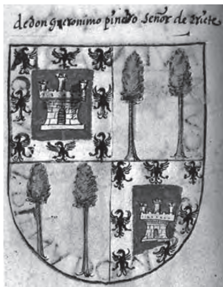
Imatge 18. Armes dels Senyors d'Eriete.