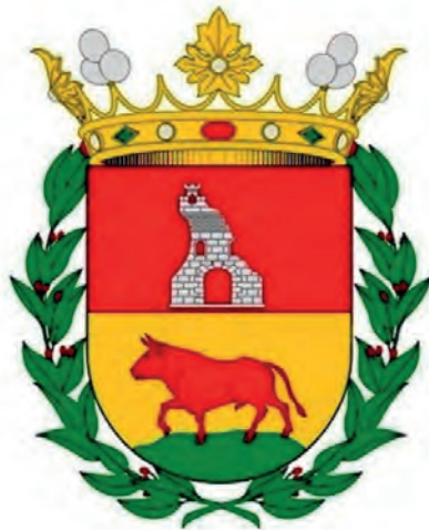
Imatge 12. Armes de Pedro Luís Galcerán de Borja.