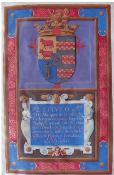
Imatge 25. Títol de Marquès de Cadereyta.