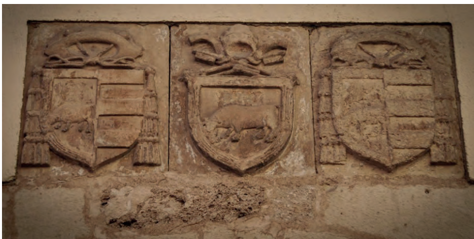
Imatge 13. Armes dels Papes Calixt III i Alexandre VI.