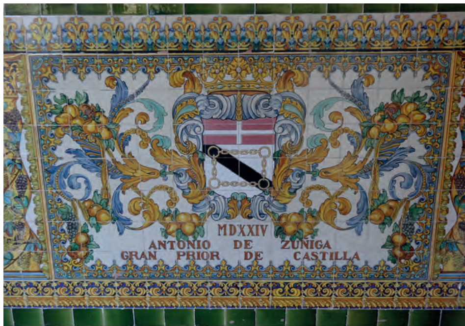
Imatge 4. Armes d'Antonio de Zúñiga.