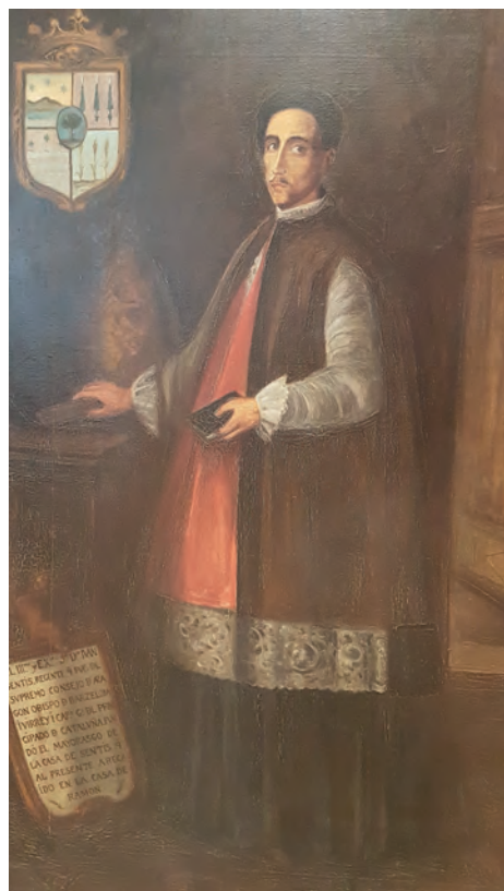
Imatge 21. Retrat del Bisbe Joan Sentís.

L'escut que figura en el retrat del bisbe a l'ajuntament de Xerta és un escut esquarterat. En el 1r quarter, sobre fons d'or hi ha tres estels d'argent sobremuntats a una muntanya del seu color natural, aquesta