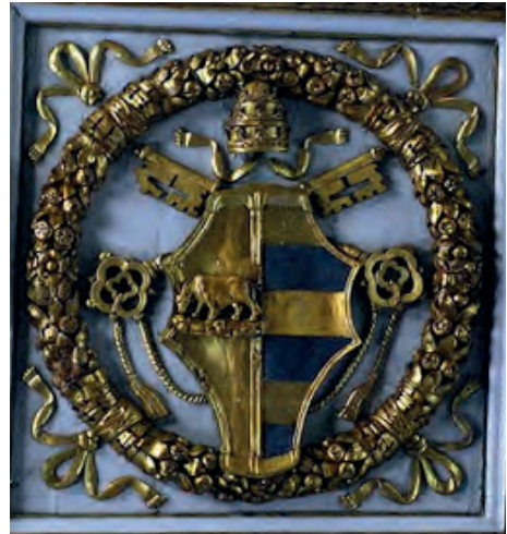
Imatge 15. Armes del Papa Alexandre VI.