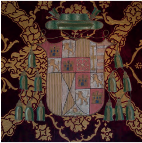
Imatge 1. Armes de Ferran d'Aragó.