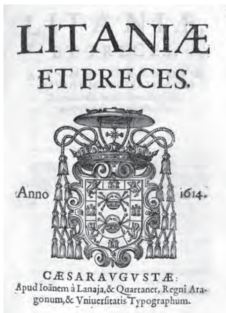
Imatge 20. Llibre de l'Arquebisbat de Saragossa.