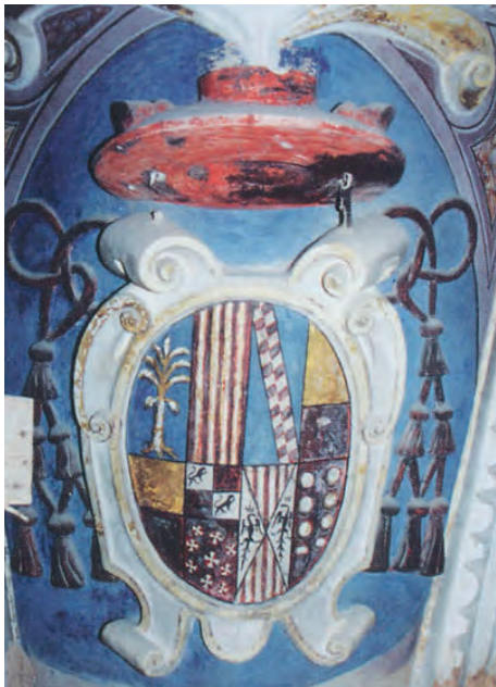
Imatge 11. Armes de Carles de Tagliavia i del seu fill Simón.