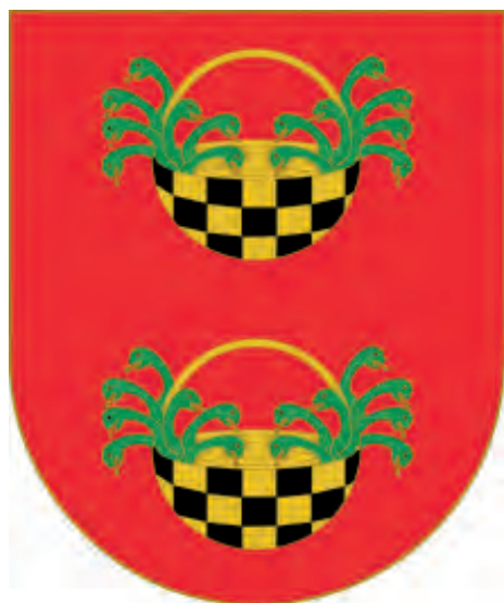
Imatge 19. Armes dels Manrique de Lara.