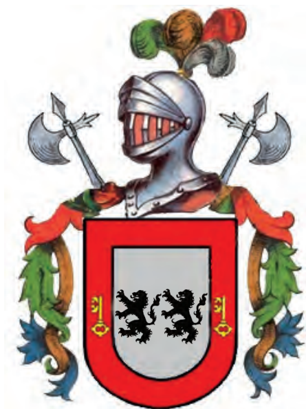
Imatge 28. Armes dels San Pedro.