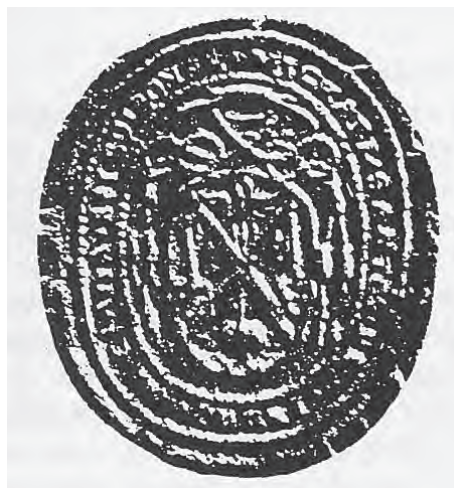
Imatge 29. Segell del Bisbe Miguel Santos.