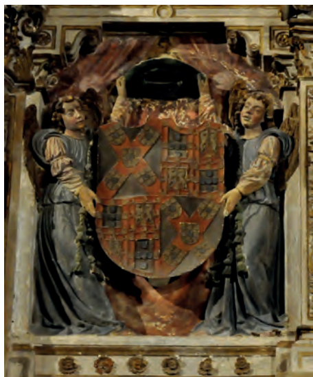
Imatge 5. Armes de Fabrique de Portugal.