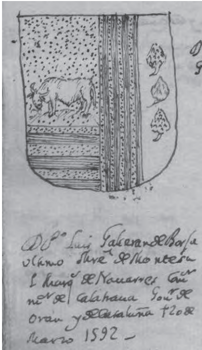
Imatge 14. Armes de Pedro Luis Galcerán de Borja.

Els escuts dels Borja els trobem al Palau de l'Ardiaca de la població de Xàtiva. Al centre l'escut del Sant Pare Calixt III, Alfons Borja, i als dos costats l'escut del seu nebot el cardenal Roderic Borja i més tard papa Alexandre VI. L'escut del Sant Pare Calixt III és d'or, un bou de gules pasturant en un camp de sinople, amb una bordura d'or carregada de vuit mates d'herba al natural. Els dos escuts del Sant Pare Alexandre VI que emmarquen l'anterior, són tots dos partits en pal, el 1r idèntic