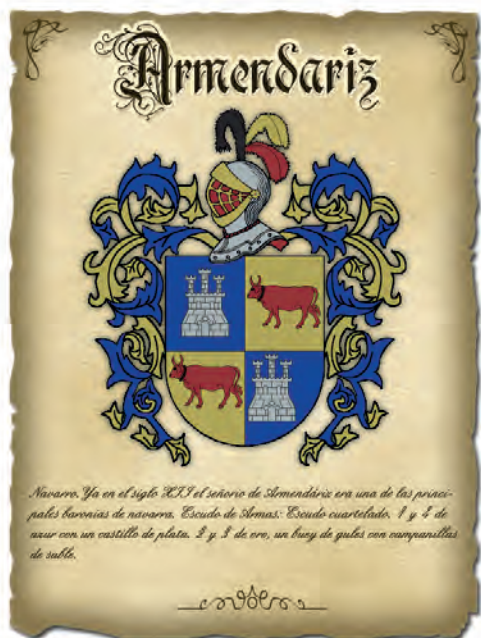
Imatge 24. Armes dels Armendariz.