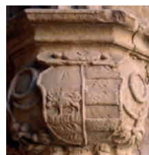
Imatge 8. Armes del llinatge Oms-Fenollet.