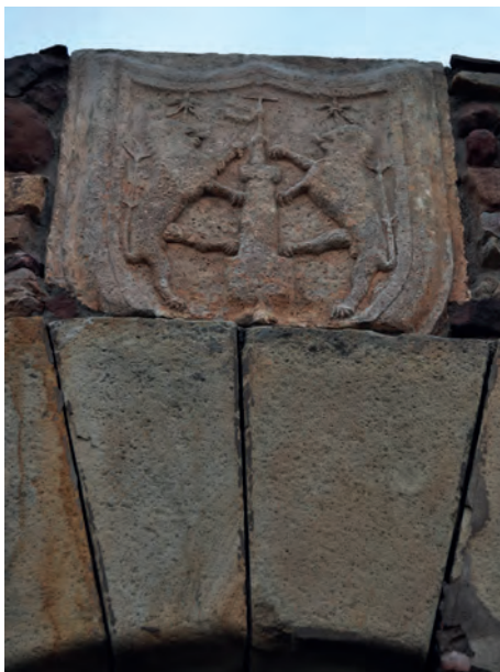
Imatge 32. Armes dels Manrique de Lara.