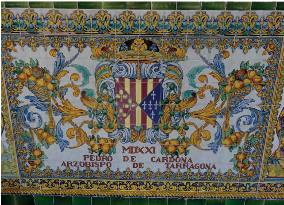
Imatge 3. Armes de Pere de Cardona.