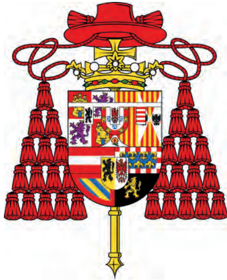
Imatge 31. Armes de Ferran d'Àustria.