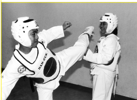
Fotografia de la Associació Esportiva Ciutat Vella-Barcelona

L'esport, parla realment totes les llengües?