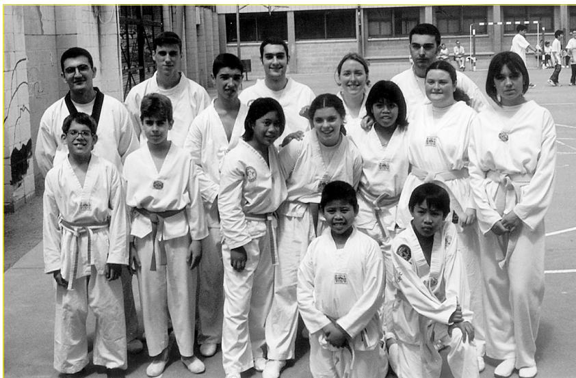
Fotografia de l'Associació Esportiva Ciutat Vella-Barcelona

Les ofertes esportives han de tenir en compte les característiques i les diferències culturals dels immigrants.