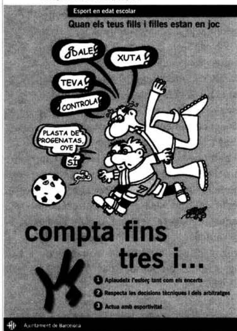
Figura 3. Eslògan de la campanya.