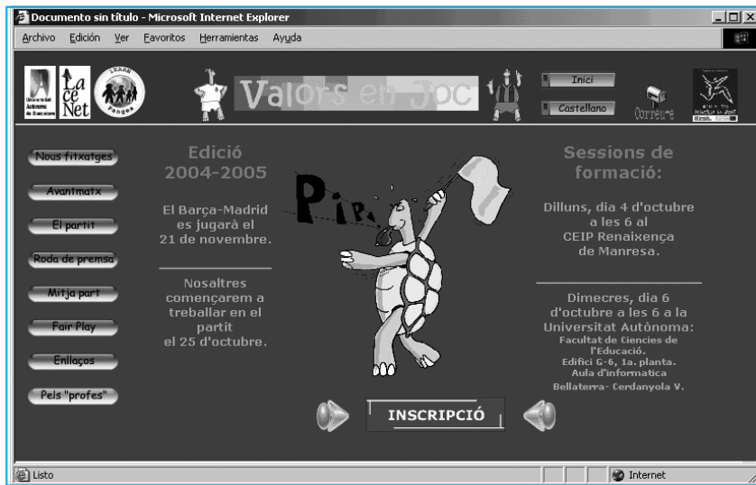
Pàgina principal del projecte sobre el "Barça-Madrid".

ens serveix de pretext per treballar els valors, i a més, representa una eina de treball altament motivant per a l'alumnat a qui s'adreça el projecte.