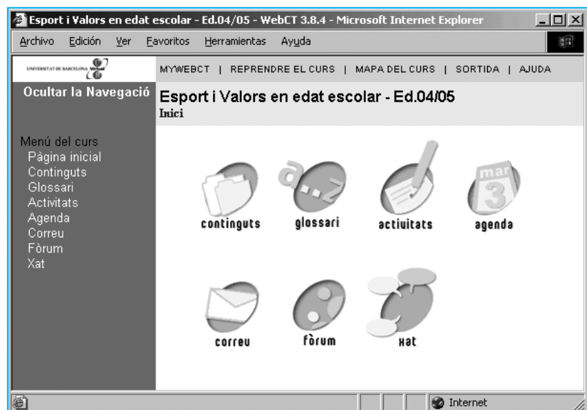
Pàgina principal del curs On Line "Esports i valors en edat escolar".

L'esport en edat escolar proporciona una considerable varietat de situacions que exposen els nois i noies davant d'eleccions, èxits, fracassos, dilemes, limitacions, desitjos, rebuigs, etc. En aquest curs s'intentarà, precisament des del l'àmbit de l'esport en edat escolar, reflexionar i aportar idees que puguin utilitzar els educadors per ajudar els joves esportistes a adquirir valors sòlids, tant en els