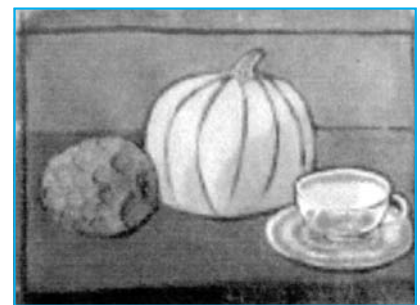
Xirimoia, carbasa i tassa. Acrílic.

Tres poemes ben diferents que tenen entre ells un element comú: el nom d'un esport. En un d'ells – La bicicleta – únicament és un títol; en un altre – Golders Green Crematorium – el tennis és un epíleg; i per últim – El camp de golf – l'esport és protagonista principal.