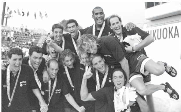
Selecció espanyola de waterpolo campiona del món a Fukuoka 2001.

Posteriorment, la selecció va aconseguir acabar en el desè lloc a l'Olimpíada de Munic (1972). Per culminar el desenvolupament del waterpolo va arribar la revolució tàctica, de la mà de l'hongarès Kalman Markovits, que s'encarregaria també de dirigir el CN Barcelona (Moreira, 1965; Gradini i Canino, 1996 i Lloret, 1998).