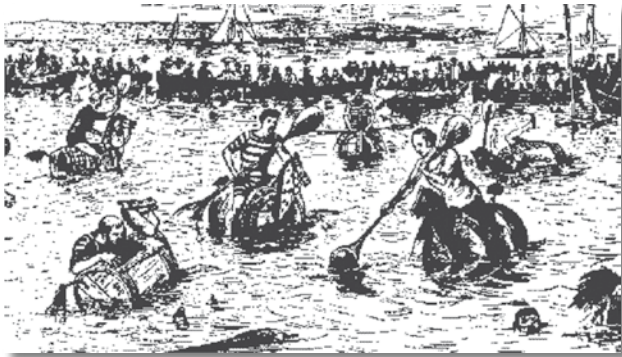
Als partits que es jugaven a llacs o rius arribaven a enfrontar-se fins a 40 jugadors (20 contra 20). (Font: Castelo, 1998.)

semblant al del rugbi: dur la pilota fins al costat contrari del camp. En els inicis del joc es realitzaven poques passes, i predominaven les accions individuals dels jugadors cap a la zona contrària per tal d'anotar un punt; era una demostració de força bruta i els participants aprofitaven l'escassa o nul·la visibilitat, a causa de l'aigua tèrbola, per a introduir la pilota sota el vestit de bany i arribar al més a prop possible de la porteria contrària bussejant. Amb el temps, va passar a practicar-se en piscines com a alternativa a la natació.