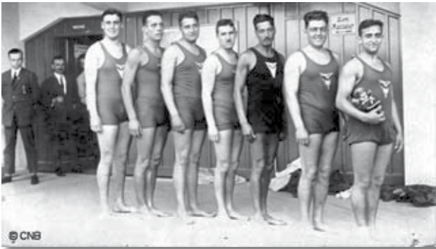
Equip de waterpolo del CN Barcelona de 1925.