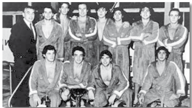
El CNB va guanyar la Supercopa d'Europa en 1981.