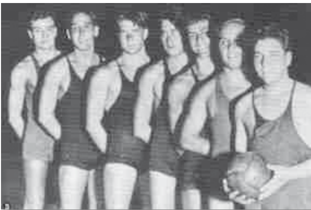
La secció de waterpolo del Real Canoe va començar a funcionar l'any 1932, per iniciativa d'Enrique Granados.

Inicialment, el waterpolo era practicat al mar i hi participaven equips d'afecionats, nedadors o mariners habituals del port, fins que en 1911 va arribar a la ciutat el Velo Club de Niça, l'entrenador del qual, Paul Vasseur, va romandre una llarga temporada a Barcelona per