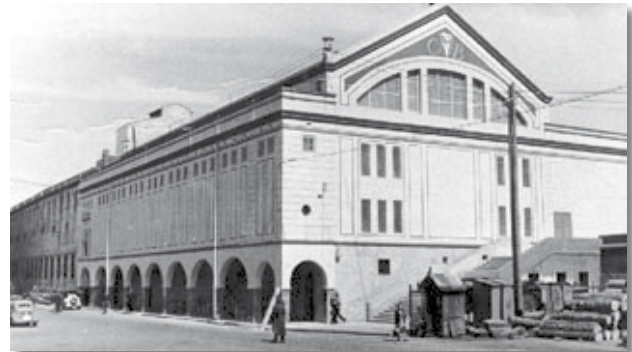
Vista exterior del CN Barcelona l'any 1955.

tal d'ensenyar part dels seus coneixements als jugadors espanyols, o sigui que el podem considerar el primer entrenador (Gosálvez i Joven, 1997). L'any següent es va disputar el primer campionat d'Espanya de waterpolo, en el qual es proclamarien campions els jugadors del CN