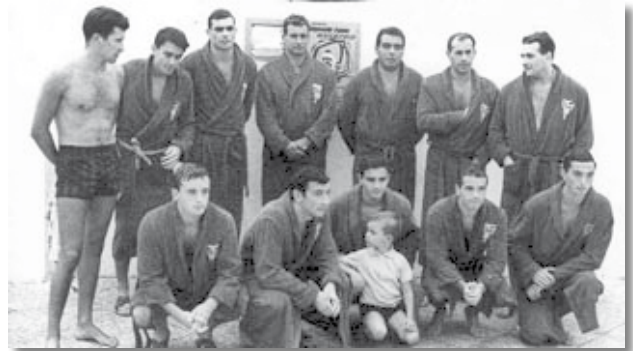
Integrants de l'equip del CNB guanyadors del campionat d'Espanya de 1964.

El 1948, amb l'arribada de Zolyomy com a entrenador del CN Barcelona i de la selecció (tots integrants del CNB), es va iniciar la "Revolució Física" a Espanya, i el nostre waterpolo va començar a tenir un cert prestigi internacional, car va aconseguir el vuitè lloc als Jocs Olímpics d'Hèlsinki (1952) on van participar 21 equips, i posteriorment el quart lloc a Nimega (Holanda), on va acabar per davant de grans potències, com ara Bèlgica i Itàlia. El mateix any dels Jocs d'Hèlsinki, Zolyomy va ser destituït, cosa que va ocasionar el declivi momentani del waterpolo a Espanya, fins que es va tornar a fer càrrec de la selecció i del CN Barcelona en 1966. Això el va tornar a fer ressorgir amb la "Segona Revolució" i es va crear una lliga amb els millors equips nacionals (sis catalans i dos de castellans), a més a més, el CN Barcelona deixa d'exercir la seva hegemonia, amb la qual cosa el waterpolo espanyol evoluciona i s'obtenen grans resultats, com el tercer lloc als Jocs del Mediterrani (1967) i l'empat a dos gols amb la "totpoderosa" Hongria en 1968.