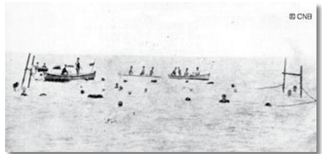
Primer partit de waterpolo que es va jugar a Espanya. Al mar, davant del CNB (1908).

El primer partit de waterpolo jugat a Espanya va ser el 12 de juliol de 1908, sota l'arbitratge de Picornell, el qual esdevindria una figura clau per a la natació i el waterpolo espanyol, entre altres coses perquè ell, al costat d'un grup de 16 amics, van ser els encarregats de fundar, el 10 de novembre de 1907, el club pioner del waterpolo espanyol, el Club Natació Barcelona (CNB) (Morera, 1965; Lloret, 1998; Gardini i Canino, 1996). Gràcies als esforços d'aquest club, van començar a organitzar-se torneigs i campionats de waterpolo i l'interès per aquest nou esport es va anar incrementant progressivament.