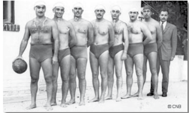
Equip de waterpolo del CNB l'any 1944.

Inicialment, el waterpolo era practicat al mar i hi participaven equips d'afecionats, nedadors o mariners habituals del port, fins que en 1911 va arribar a la ciutat el Velo Club de Niça, l'entrenador del qual, Paul Vasseur, va romandre una llarga temporada a Barcelona per