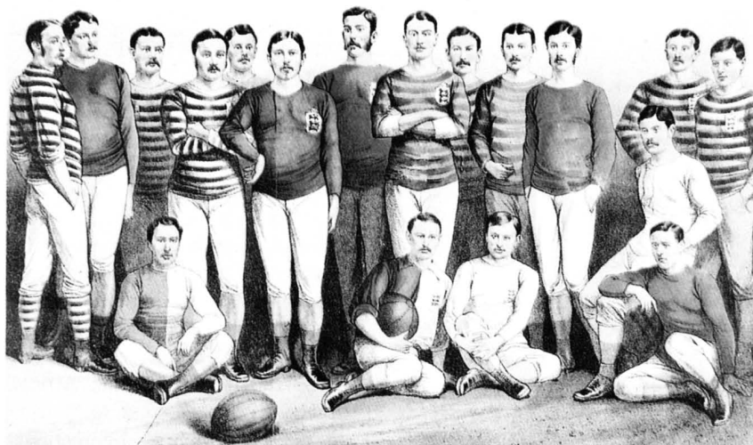
Pintura de los primeros jugadores de rugby