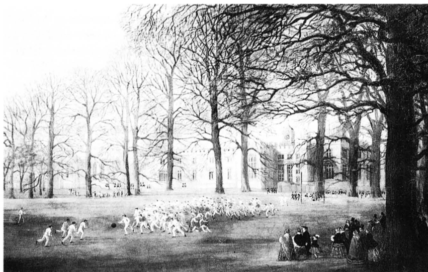
Pintura alegórica: el juego de fútbol de la época

llamaba battle horses o bulldogs ; a los más bajos y rápidos, que esperaban la salida de la pelota, se les llamaba light brigade o traviesos .