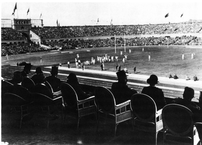
Inauguración del Estadio de Montjuic