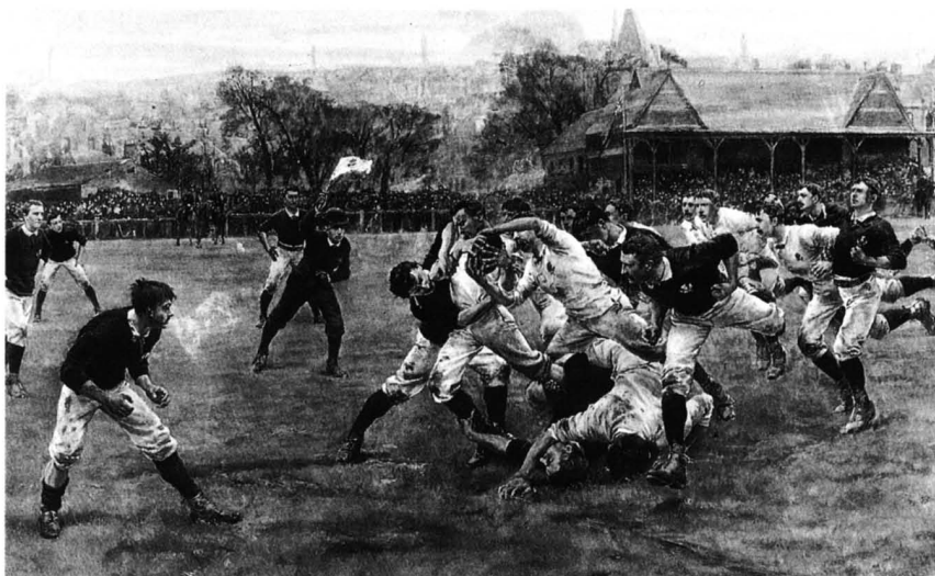
Primer partido internacional: Inglaterra-Escocia