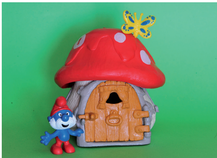
El Gran Barrufet.

ja que les seves aventures s'han tramès -com comentarem- a través de les tècniques científiques de difusió més avançades i sofisticades. Són un fenomen singular i les seves representacions materials mostren les més variades situacions individuals, entre les quals s'hi troben esportistes. Curiosament aquests, els barrufets esportistes, que són nombrosos, no han merescut comentaris dins l'extensa literatura multinacional existent. L'associació d'aquestes variades circumstàncies ens ha portat a redactar aquest treball.