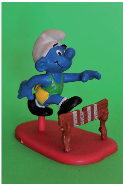
Corredor de tanques.