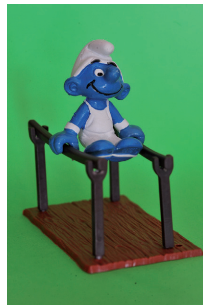
Gimnasta de paral·leles.