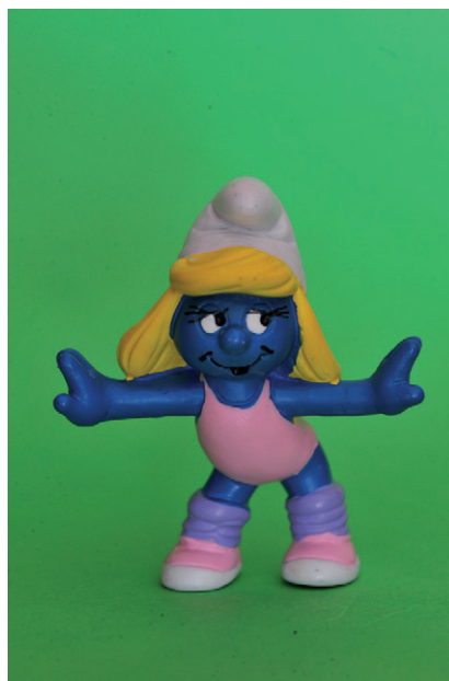
Barrufeta fent gimnàstica artística.