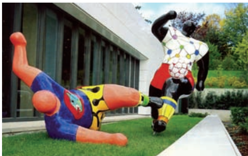
Figura 1 Futbolistas , escultura, gran format (1993).

Catherine Marie-Agnes de Saint-Phalle nasqué el 29 d'octubre de 1930 a Neuilly-sur-Seine (França), país on habitava circumstancialment la seva família nord-americana de banquers, com a conseqüència d'haver-se arruïnat en la crisi econòmica de la darrera dels anys vint. Durant 3 anys va continuar vivint amb els seus avis paterns, i tornà a Greenwich (Connecticut) amb els seus pares el 1933. La formació juvenil i els seus inicis artístics tingueren lloc a Nova York, ciutat on residí més o menys con-