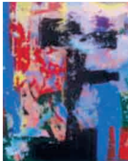
Figura 7 Divergence.