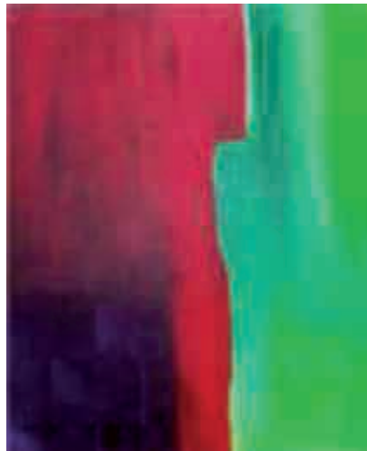
Figura 15 Red and Green.