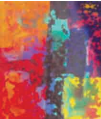
Figura 14 Jigsaw.