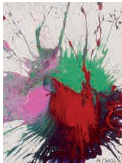
Figura 25 Impact Art : tela 90.