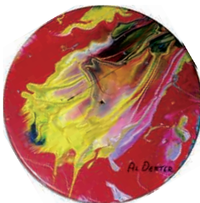
Figura 24 Impact Art : disc 78.