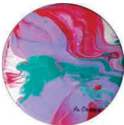
Figura 22 Impact Art : disc 76.