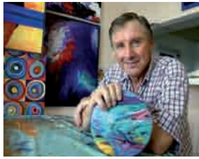
Figura 3 Al Oerter, pintor.

es va classificar amb penes i treballs, com a tercer en les proves de selecció per als Jocs de Mèxic'68. En els 3 últims llançaments de la competició va aconseguir les 3 millors marques de la seva història esportiva i va establir, amb 64,78 m, un nou rècord olímpic. Encara que tenia solament 32 anys i hauria pogut anar a Munic'72, va decidir de retirar-se.