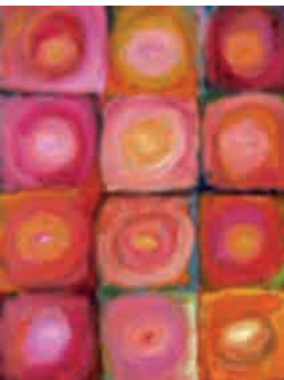
Figura 17 Pattern.