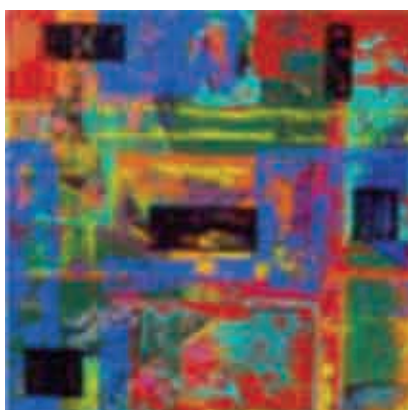
Figura 12 Illusive Self.