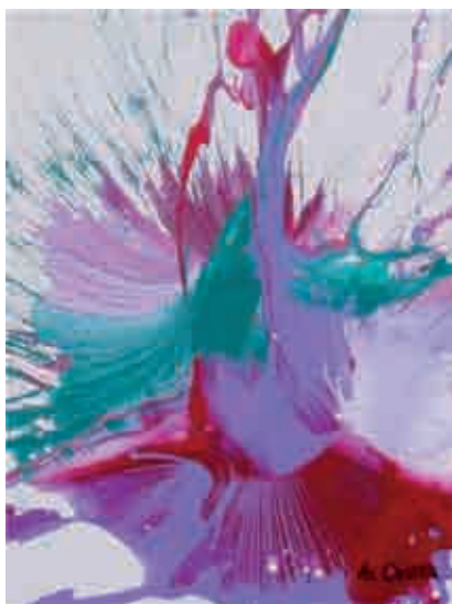
Figura 21 Impact Art : tela 76.