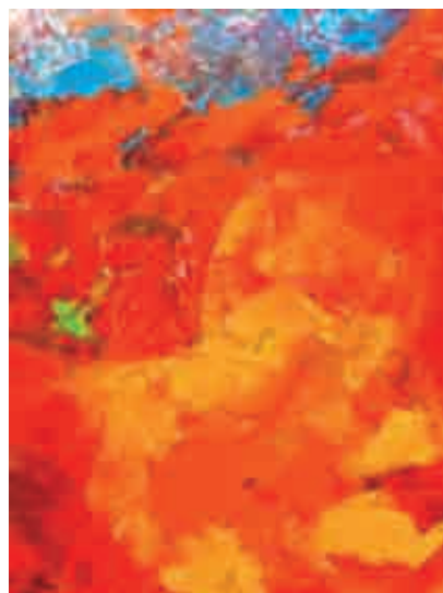
Figura 18 The Boxer.