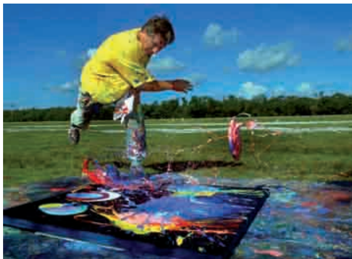
Figura 20 Al Oerter ( Impact Art ).