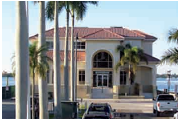
Figura 27 Galeria Art dels Olímpics.