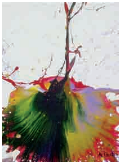
Figura 23 Impact Art : tela 78.