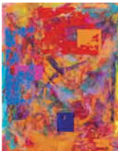
Figura 9 Elevated Self.