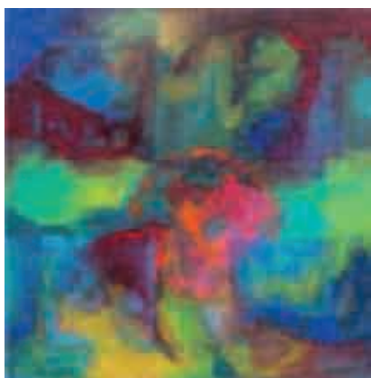
Figura 8 Eclipsi.