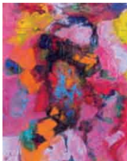
Figura 10 Geisha.