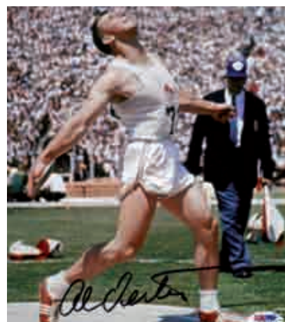
Figura 1 Al Oerter, Melbourne'56.

Estudiant encara a la Universitat de Kansas, als 20 anys va aconseguir un lloc per participar en els Jocs de Melbourne'56, en ser repescat per lesió de Ron