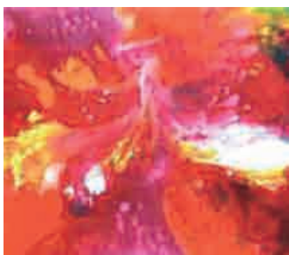
Figura 11 Ignition.