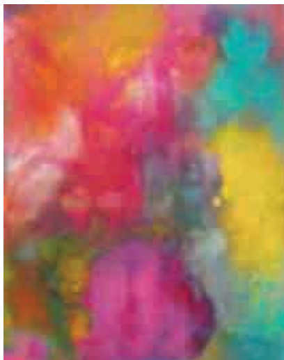
Figura 6 Aura.