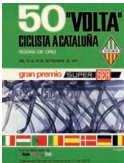
Figura 12 Cartell de la 50a Volta, 1970. Autor: Mauri.