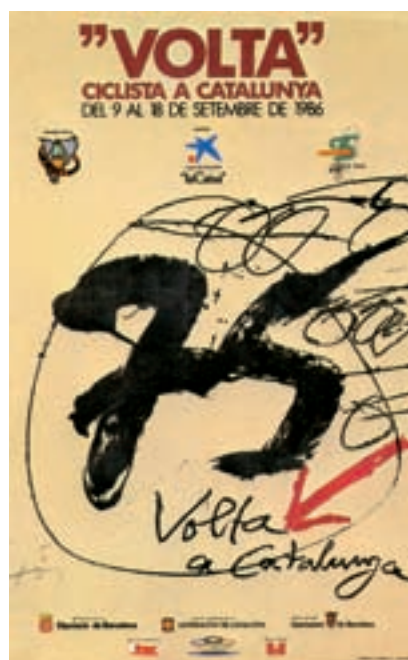
Figura 17 Cartell de la 66a Volta, 1986. Autor: A. Tàpies.