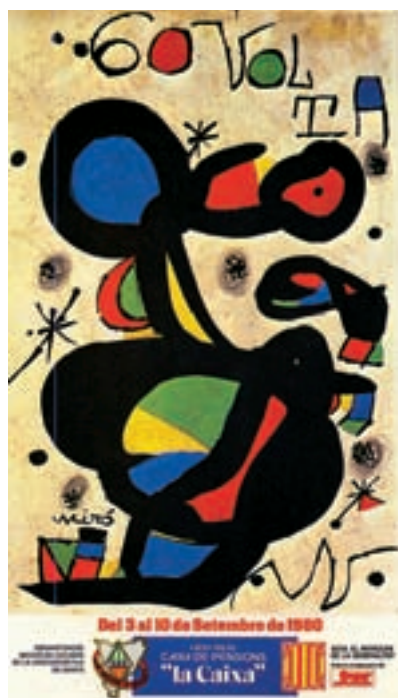
Figura 14 Cartell de la 60a Volta, 1980. Autor: J. Miró.