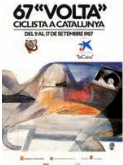
Figura 20 Cartell de la 67a Volta, 1987.

Martín Perdiguero (84a) i David Cañada (86a). Van participar en la Volta reconeguts ciclistes estrangers, com Rominger, Bugno, Bruynel, Alvaro Mejía (guanyador de la Volta 73a), Claudio Ciapucci (74a), Laurent Jalabert (75a), Alex Zulle (76a), Hernán Buenahora (78a), Yaroslav Popovych (85a) i Vladimir Karpets (87a). El 2005 la Volta ad-