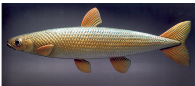
Figura 7 Leiciscus cephalus