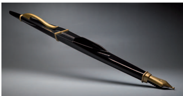
Figura 11 Grafòmana.