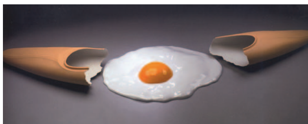
Figura 8 Cosmogònica