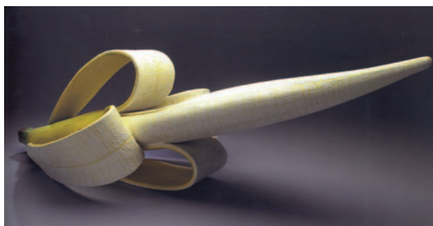
Figura 9 Exfoliable.