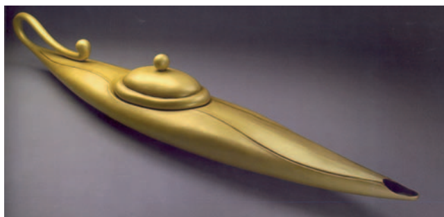
Figura 12 Canoa d'Aladino.