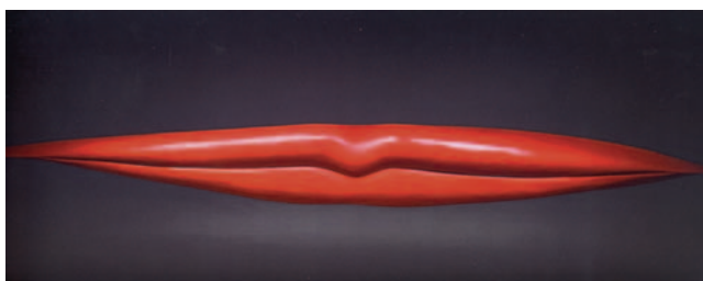
Figura 5 Labra.