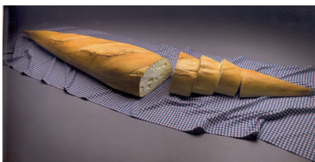
Figura 6 Adýnaton?