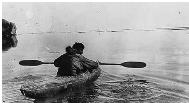
Figura 1 Caiac esquimal.