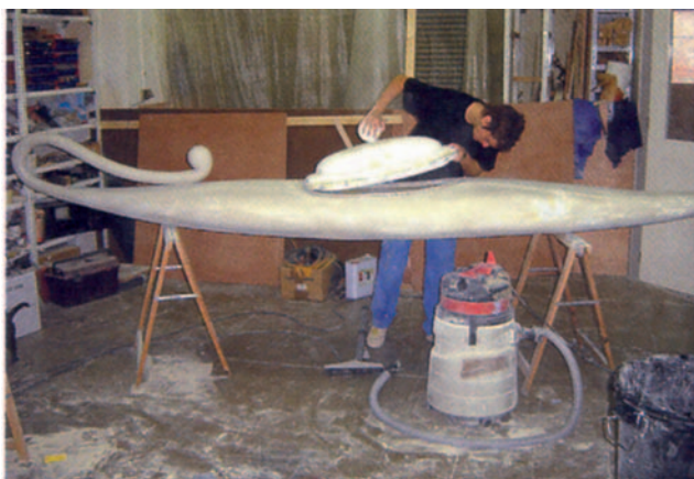
Figura 15 Construcció de la Canoa d'Aladino.

A part de l'indiscutible valor artístic de la totalitat de les obres, s'ha de ressaltar molt especialment la seva originalitat i la sens dubte dificultat en la realització.