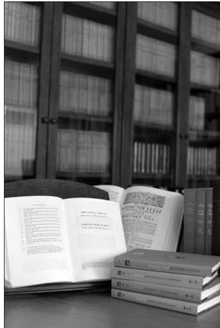
Col·lecció i traducció de l'obra llatina de Ramon Llull