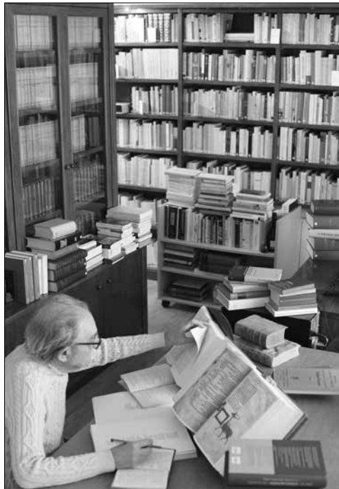
Sala estudi biblioteca de la Fundació Que Alt