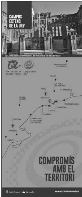
Banderola URV Campus extens

En aquest sentit, una fundació de naturalesa humanista, que treballa amb modèstia ambició i rigor científic, des d'un realisme idealista, pot ajudar la Universitat a acomplir, en efecte, «un paper rellevant en la configuració d'una societat democràtica, justa i plural que conjugui el progrés amb el respecte a les persones [...] impulsant la reflexió crítica en benefici de la societat» tal com s'expressa en la Visió estratègica de la URV.