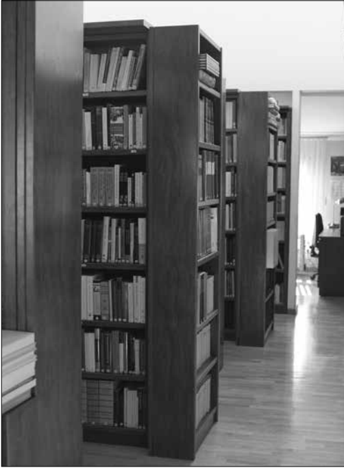
Mostra del fons de la biblioteca de la Fundació Quer Alt