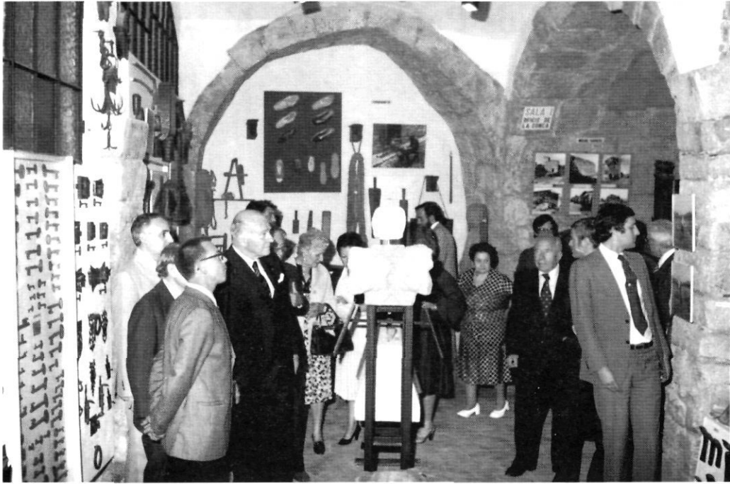
Inauguració oficial de les noves instal·lacions del Museu duta a terme pel Molt Honorable Senyor Josep Tarradellas, president de la Generalitat de Catalunya, l'any 1978.

per la Generalitat de Catalunya, l'Ajuntament de Montblanc i l'Associació Museu Arxiu. El Museu s'amplià amb l'annexió de dos edificis (les Escrivanies Reials). Dins el Museu s'integren les següents seccions: el Grup Sardanista, el Centre d'Estudis de la Conca de Barberà i el Centre d'Història Natural de la Conca de Barberà. Juntament amb aquestes seccions també es creen tres museus monogràfics: el Museu d'Art Marès, el Museu Molins de la Vila i el Museu del Vidre de Vimbodí. El Museu, actualment, és un dels més importants de la demarcació de Tarragona i té un nombre notable de visitants. Aquesta realitat actual s'ha assolit gràcies a aquells membres fundadors, com el Lluís París, que creen l'embrió del que és ara el Museu.