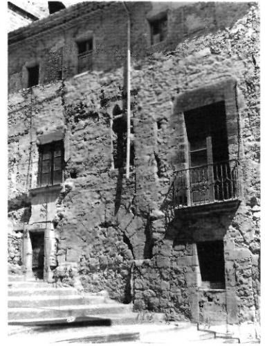
Façana gòtica del Museu abans i després de restaurar-lo.

El 5 de setembre de l'any 1970, el Museu organitza, amb el suport de l'Ajuntament i la comissió organitzadora, les Festes Populars de Cultura Pompeu Fabra. L'acte central, multitudinari, es va celebrar a l'església de Sant Miquel. Aquestes festes tingueren un gran ressò arreu de Catalunya.