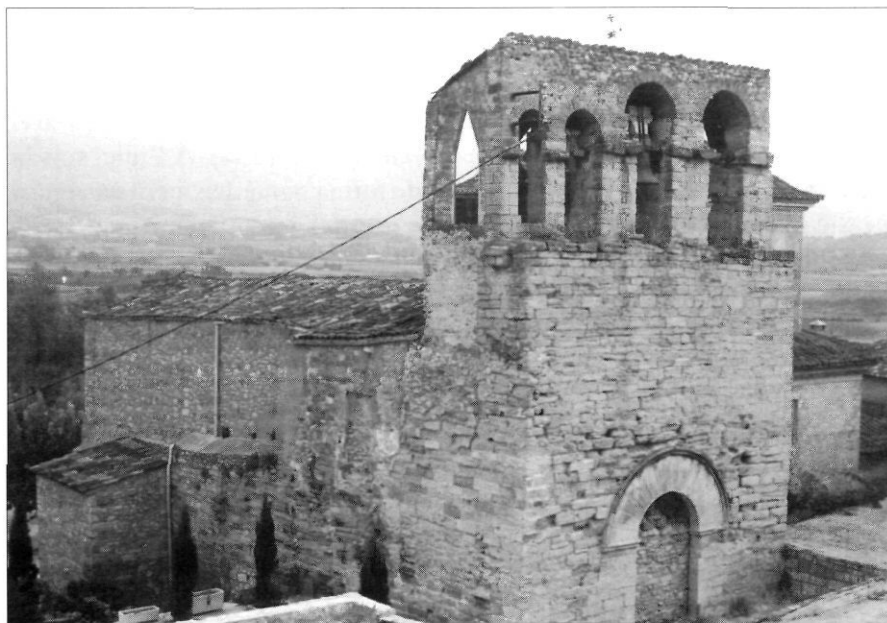
Església de la Guàrdia dels Prats.

- Llibre de "Cuentas de carga y data del culto de la parroquia" (1920-1933). Foli. Reg. 11 caixa 8. Conté els comptes de l'església parroquial, l'ermita i els altars de les Ànimes, del Roser i el la Puríssima Concepció. Inclou les fundacions de misses i administració de les almoines. S'hi adjunten els volants o comprovants de les despeses en cera, roba, neteja, obres, etc. (factures de comerços i treballadors de Montblanc, Tarragona, Reus i Barcelona). Hi ha dos fulls dels comptes d'obres a l'abadia del 1856, i 1899-1903. Al final trobem el segell del govern eclesiàstic de Tarragona d'aprovació dels comptes.