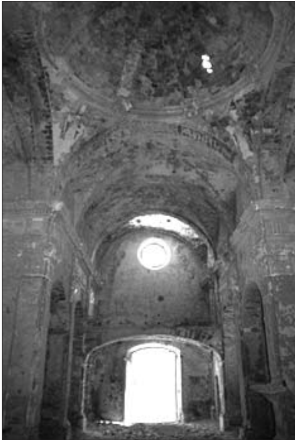
Fig. 4. AFCEC_GARCIA_ROMANIC_2783. Germà García, 1998. Detall de l'interior de l'església des del presbiteri en direcció a la façana.

Abans de la Guerra Civil, F. Blasi documenta l'existència d'una mare de Déu del Roser a Santa Perpètua, encara que no en podia justificar la procedència 41 .