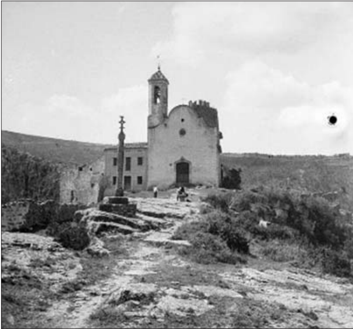
Fig. 3. AFCEC_BLASI_B_00761.

Façana de l'església de Santa Maria. Perpètua de Gaià. Entre 1920-1930.